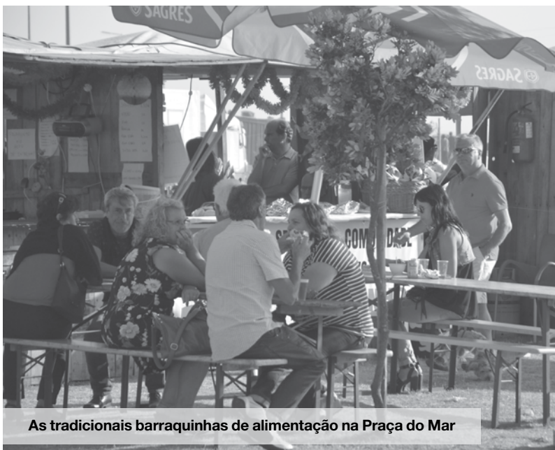
As tradicionais barraquinhas de alimentação na Praça do Mar