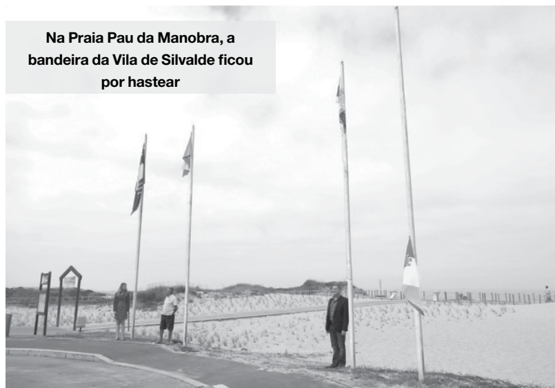
Na Praia Pau da Manobra, a bandeira da Vila de Silvalde ficou por hastear

O insólito aconteceu na Praia Pau da Manobra, em Silvalde. Sem nenhum membro do executivo silvaldense presente, os responsáveis optaram por não erger a bandeira da vila silvaldense, ficando assim a meia haste. Bem mais tarde, e já sem a presença