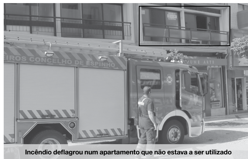
Incêndio deflagrou num apartamento que não estava a ser utilizado

Cinco pessoas foram assistidas por inalação de fumo, entre elas um bebé de dois meses, devido a um incêndio que deflagrou na manhã de segunda-feira, num prédio na rua 19.