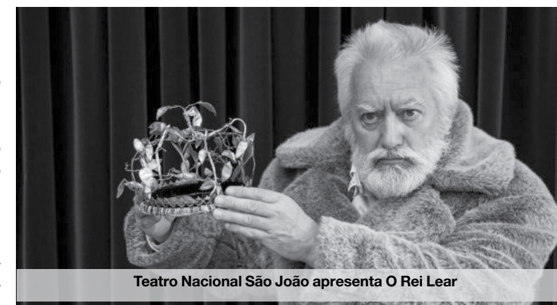
Teatro Nacional São João apresenta O Rei Lear

No Mosteiro de São Bento da Vitória, de 4 a 15 de julho, terá lugar a desMOSTRA. Sem recorrer a uma temática específica, o evento abre-se às propostas práticas e à vontade de participação e organização dos artistas, sendo que os formatos de pesquisa e de partilha são decididos pelo grupo. O evento dedica-se numa primeira fase ao estudo e discussão das propostas a desenvolver e, numa segunda fase, à partilha com o público desse processo de