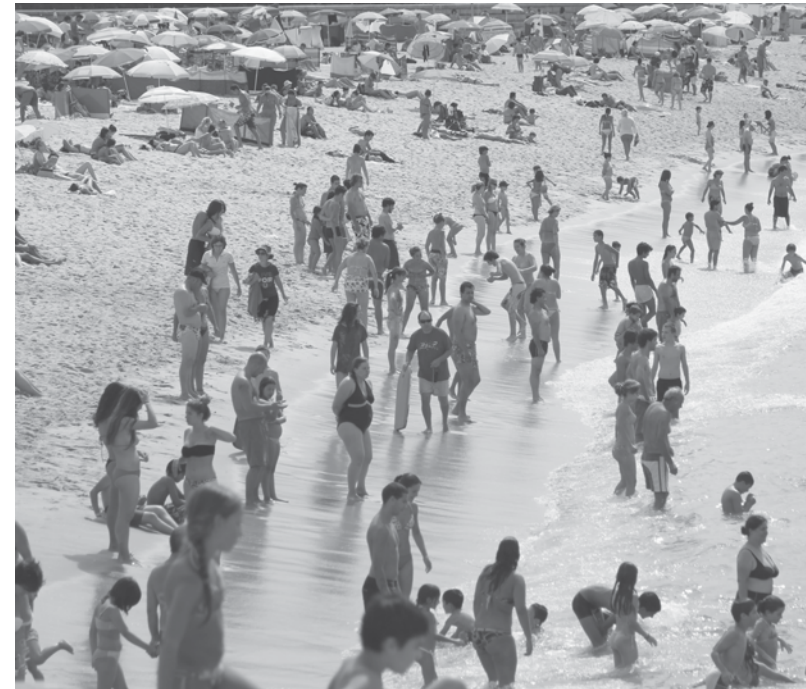
Praia da Baía continua a ser uma das mais procuradas

Munidas de cinco bandeiras azuis, são várias as praias no concelho que se mostram dignas de serem utilizadas para férias. “Adoro fazer praia em Espinho. Tirando aqueles dias de nortada, é um local excelente para apa-