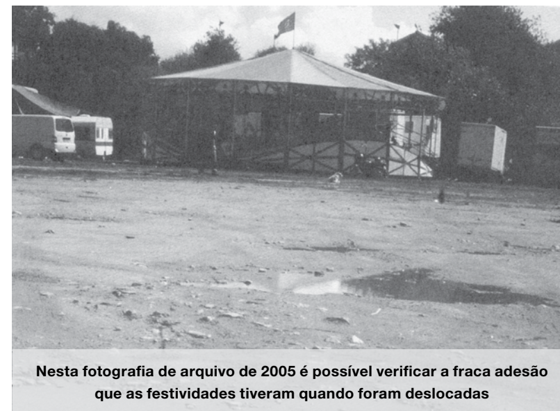
Nesta fotografia de arquivo de 2005 é possível verificar a fraca adesão que as festividades tiveram quando foram deslocadas

Em 2004 as festividades de Nossa Senhora da Ajuda mudaram-se de armas e bagagens para a entrada norte da cidade, devido às obras de enterramento da linha. Concluído esse processo as festas voltaram à Alameda mas, ao que tudo indica, em 2017 devem mudar de sítio novamente devido ao arranque das obras de requalificação da Alameda. A autarquia revelou ter este processo pensado e sem levantar muito o pano afirma que as festas de 2017 “não sairão prejudicadas pela execução da empreitada”.