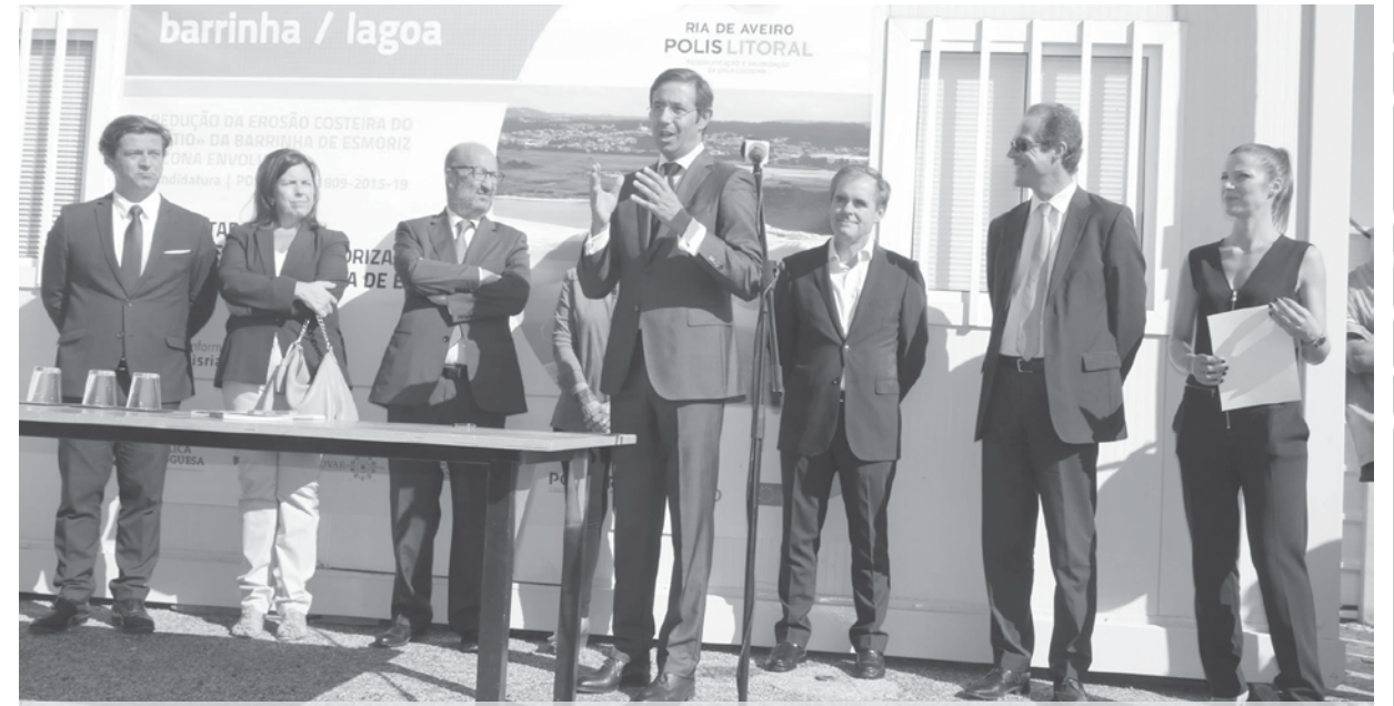
Obras na Barrinha, orçada em quase três milhões de euros, há muito que era ansiada pela população e autarcas locais

A empreitada que agora avançará no terreno, e cujo processo está a cargo do programa Polis Litoral Ria de Aveiro, foi adjudicada por 2,749 milhões de euros (mais IVA). Segundo anunciou a Polis Litoral Ria de Aveiro, a interven-