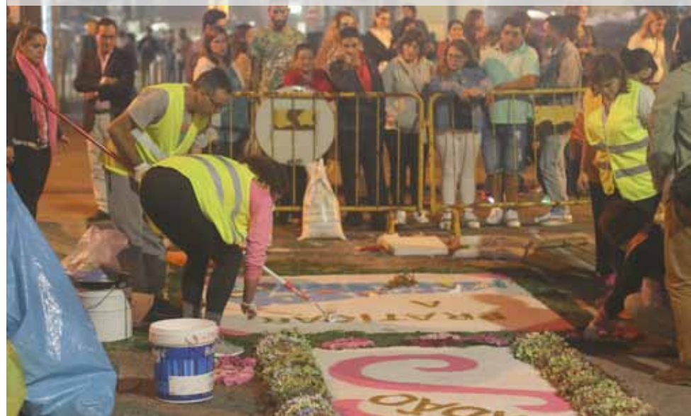
Tapetes de Flores começaram a ser feitos no sábado à tarde e duraram pela noite dentro