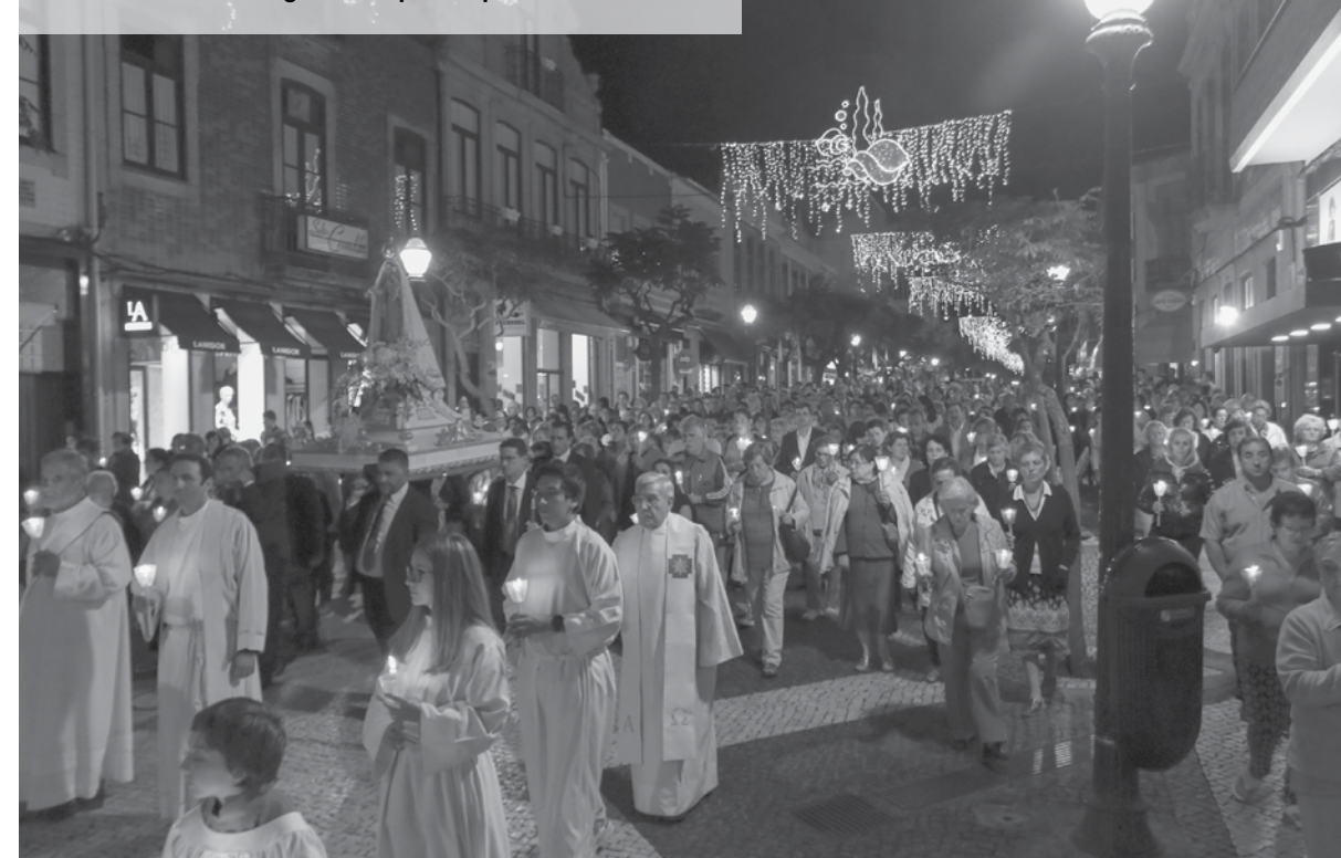
Centenas de fiéis seguiram de perto a procissão das velas