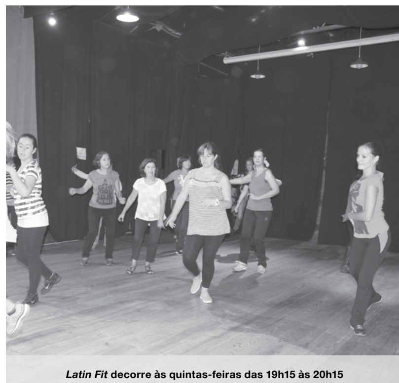
Latin Fit decorre às quintas-feiras das 19h15 às 20h15

Palcos, a Nascente organiza um passeio cultural à cidade do Porto. O programa já está fechado e contempla uma visita guiada ao Teatro Rivoli e programação 2016 e o visionamento do espetáculo de dança contemporânea