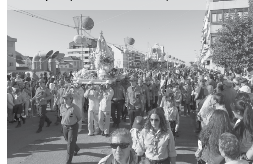
Majestosa procissão trouxe milhares a Espinho