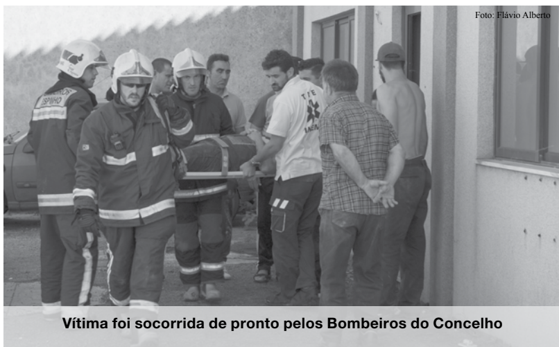
Vítima foi socorrida de pronto pelos Bombeiros do Concelho

Na tentativa de socorrer o colega, outro funcionário partiu um vidro para entrar no armazém mas efetuou um corte profundo na zona do braço. O patrão das duas vítimas estava no local e acabou por sentir uma indisposição. Todos os feridos foram resgatados e tratados pelos Bombeiros Voluntários do Concelho de Espinho que rapidamente chegaram ao local. NO