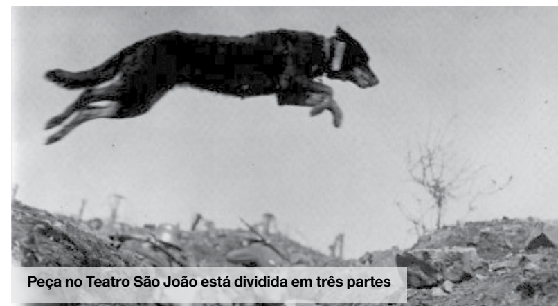
Peça no Teatro São João está dividida em três partes

Os Últimos Dias da Humanidade começou a ser escrito em 1915, e nele Kraus encenou as conversas inspiradas pela guerra nas ruas, nas redações dos jornais, nos quartéis e nos salões. Do monumental edifício original do texto foi extraída uma dramaturgia que segue a progressão cronológica dos acontecimentos da época, desde o assassinio do arquiduque Francisco da Áustria até à derrota dos