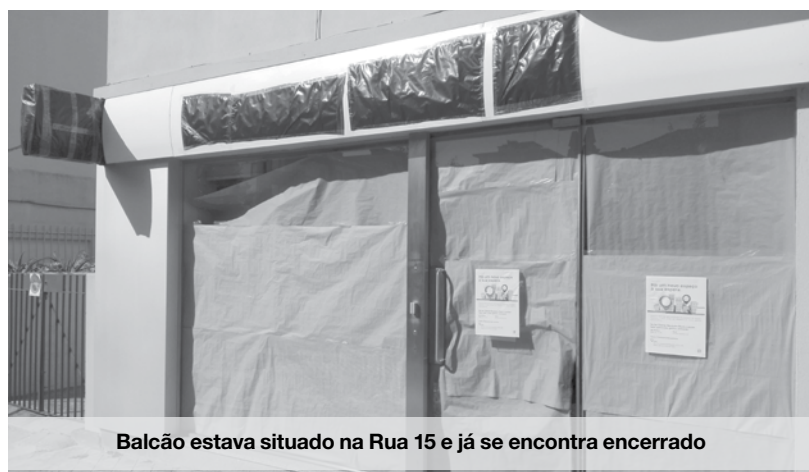
Balcão estava situado na Rua 15 e já se encontra encerrado

Situada na rua 15, a sucursal do banco alemão em Espinho aparentemente já fechou as portas. Segundo o que o Maré Viva apurou, uma grande parte dos funcionários foi colocado noutras locais enquanto alguns chegaram ao acordo para sair. Na porta do antigo banco encontra-se um le-