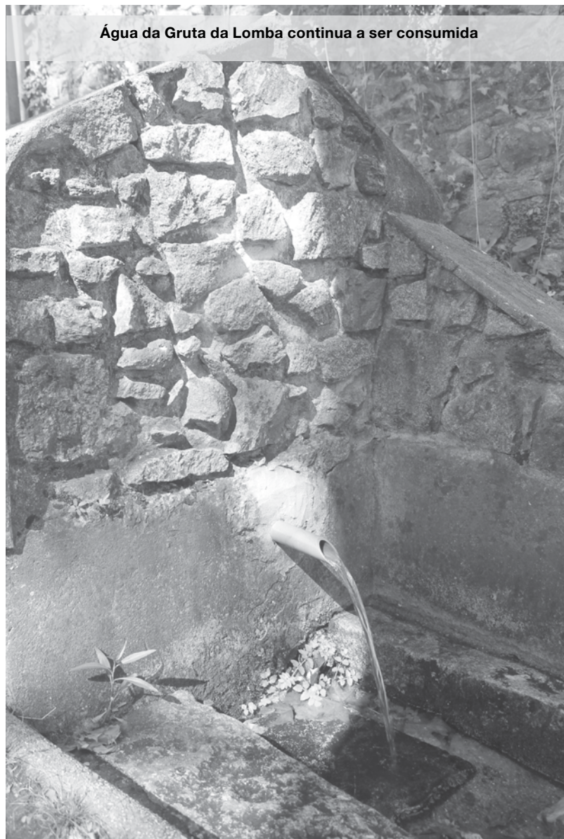
Água da Gruta da Lomba continua a ser consumida

A mala aberta de viaturas à porta do Parque da Gruta da Lomba a serem carregadas de garrações de água é uma visão frequente. Muitos utilizam a água proveniente daquela fonte para regar as plantas, cozinhar e para beber. Porém, há vários anos que não são efetuadas análises de controle de água e como tal, segundo a Junta de Freguesia, está conotada como imprópria para consumo. Ainda assim, há muita gente que arrisca.