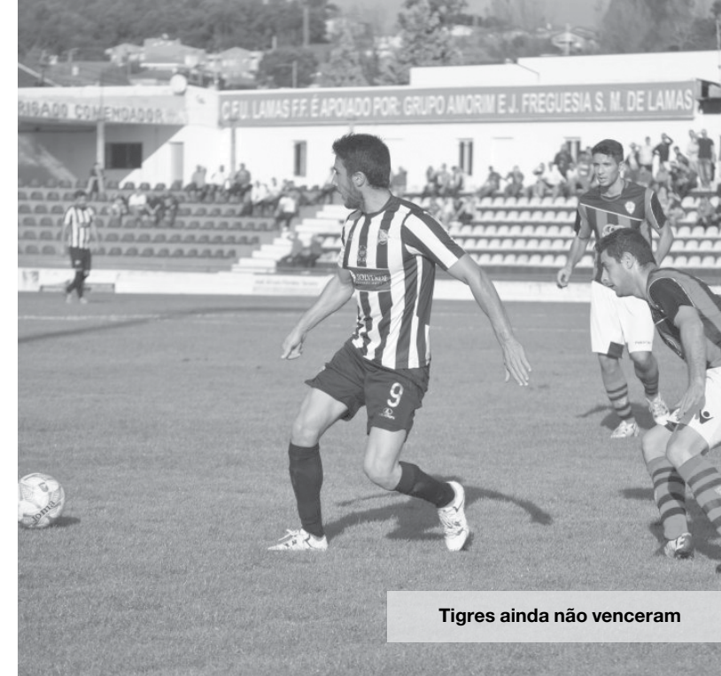
Tigres ainda não venceram