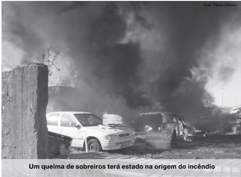
Um queima de sobreiros terá estado na origem do incêndio

A PSP de Espinho também foi chamada para investigar as causas do incêndio. PJD