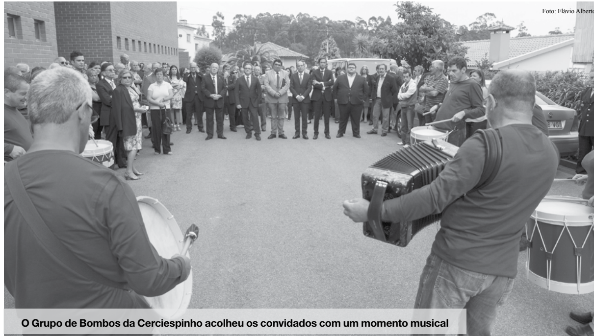
O Grupo de Bombos da Cerciespinho acolheu os convidados com um momento musical

Cerciespinho celebrou o 40º aniversário numa sessão solene com diversas homenagens a grupos de pessoas ligadas à instituição e a entidades que ajudaram a coletividade a crescer.