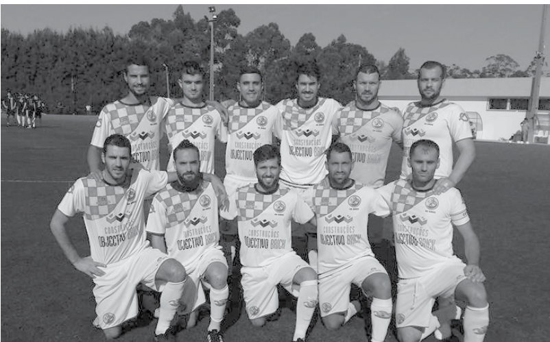
Apesar do campeonato estar adiado realizou-se a Supertaça. Os Leões venceram por 1-0 o Grupo Desportivo dos Outeiros

A Associação Futebol Popular do Concelho de Espinho informou, em comunicado aos clubes, que o início do Campeonato da 1 e 2 divisões, época 2016/2017, está adiado por tempo indeterminado.