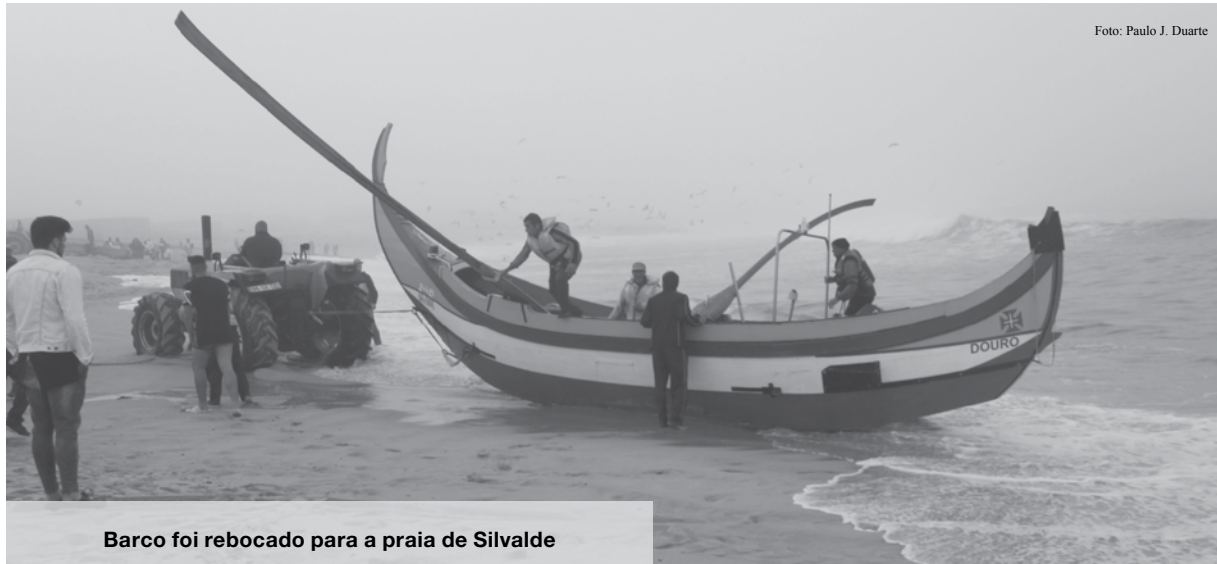
Barco foi rebocado para a praia de Silvalde

F oram momentos de aflição vividos no domingo de manhã ao largo da Praia de Paramos. A embarcação "Mar de Esmoriz" foi atingida por uma onda e ficou alagada, tendo o motor parado. Os quatro pescadores foram resgatados por um embarcação que estava na praia de Paramos.