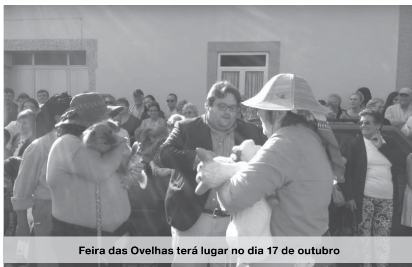
Feira das Ovelhas terá lugar no dia 17 de outubro

Até às 20h00 e a partir das 15h00 há Concerto das Bandas de Música. O dia encerra com a atuação do Grupo “Tekos” às 21h00. Na segunda-feira, dia 19, às 9h00, há atuação da Tuna Musical de Anta. Às 11h00, terá lugar a Eucaristia Solene seguindo-se a Majestosa Procissão. Por volta das 15h00 terá lugar a