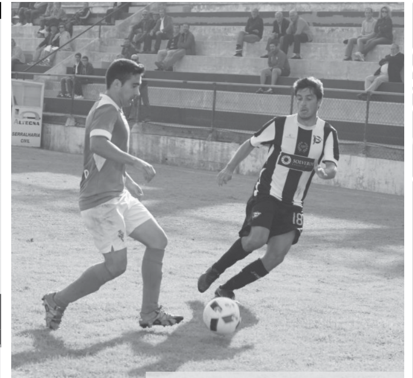
Tigres conquistaram finalmente os três pontos

Com um rendimento claramente superior e com rápidas trocas de bolas, o domínio inicial do encontro pendeu sempre para o lado dos tigres. Aos vinte minutos, Carlitos deu um pontapé na crise e colocou o Sp. Espinho em vantagem. Porém, alguns jogadores ainda estavam a festejar quando Cris estabeleceu a