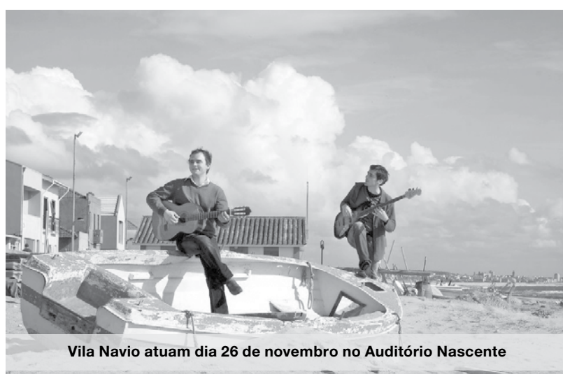
Vila Navio atuam dia 26 de novembro no Auditório Nascente

Estas iniciativas têm preços diferenciadas para sócios e não sócios da cooperativa, pelo que vale bem a pena preencher a ficha de adesão e passar a ter um cartão que também dá descontos em diversas salas de espetáculos do Grande Porto. MV