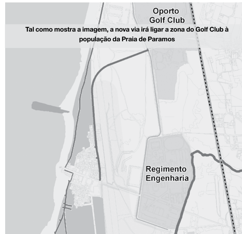
Tal como mostra a imagem, a nova via irá ligar a zona do Golf Club à população da Praia de Paramos