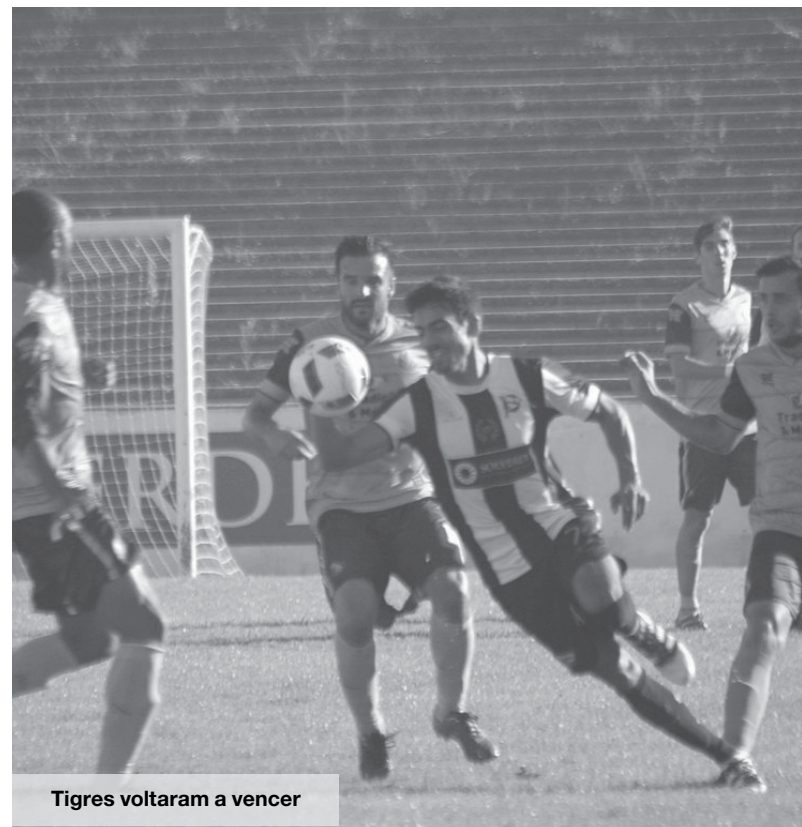
Tigres voltaram a vencer

Sete minutos volvidos e os adeptos vareiros voltaram a festejar golo após uma rápida jogada de contra ataque.