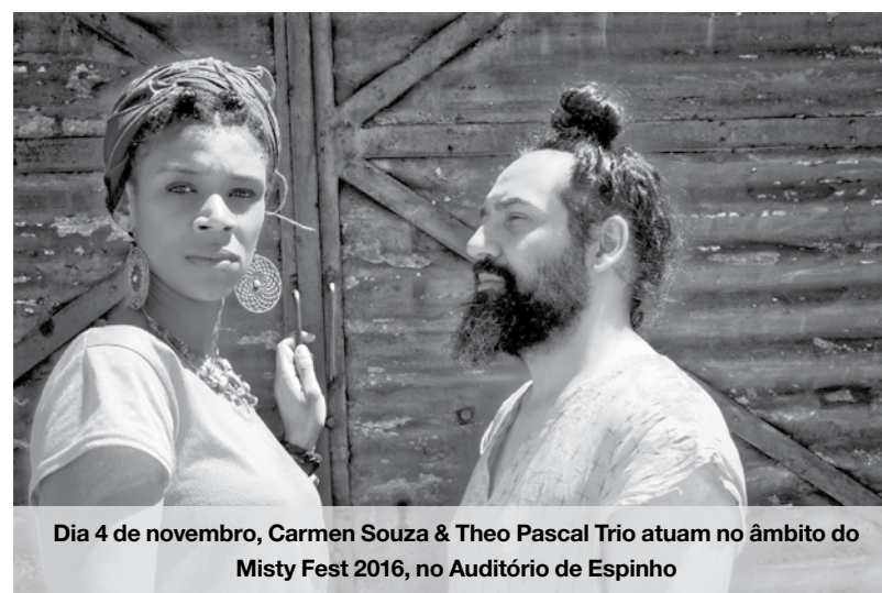
Dia 4 de novembro, Carmen Souza & Theo Pascal Trio atuam no âmbito do Misty Fest 2016, no Auditório de Espinho

E m novembro o Auditório de Espinho, como já é habitual, chega com uma programação recheada. Este mês será marcado por vários concertos com uma versatilidade de géneros, incluindo o primeiro integrado no âmbito de Anta-Capital do Violino.