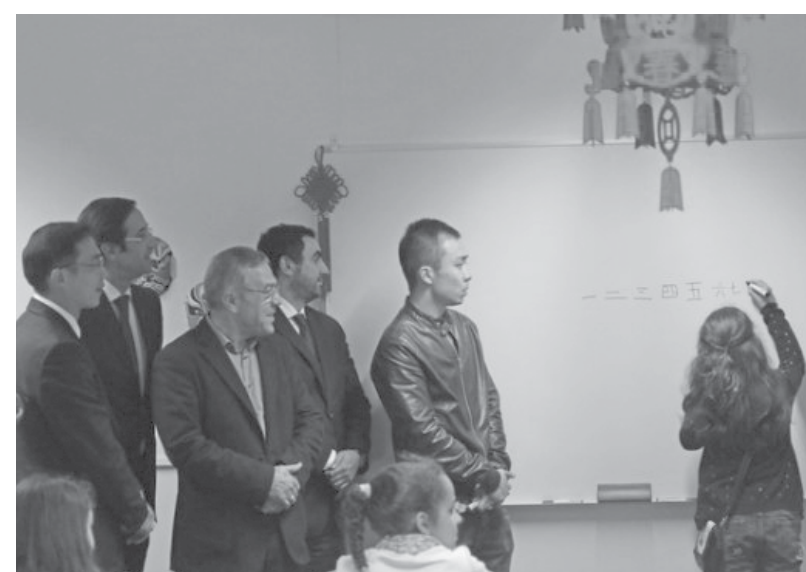
Autarcas assistiram a uma aula de mandarim em S. J. da Madeira

Em S. João da Madeira as aulas de mandarim estão, desde 2012, disponíveis para alunos dos 3.º, 4.º e 5.º ano do ensino básico.