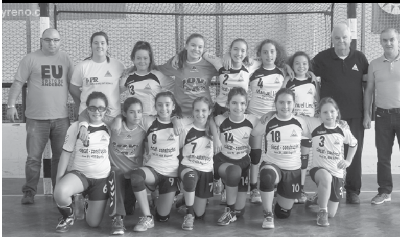
Infantis perderam 26-23

A primeira equipa a sentir o sabor amargo da derrota, foram as infantis, que no sábado de manhã, na deslocação ao reduto do Salreu, não conseguiram bater a equipa da casa, e perderam por 26-23. Igual sorte tiveram as iniciadas, frente ao Vacariça, num jogo bastante equilibrado como é da praxe, com algumas mudanças na liderança do marcador, mas que acabaram por ceder na reta final e perderam por 25-28. NO