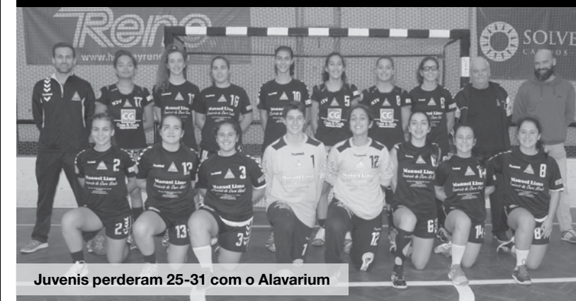
Juvenis perderam 25-31 com o Alavarium

Finalmente, passadas 24 horas, entraram novamente em cena as infantis, para receberem a equipa do Alavarium em jogo atrasado, mas também não foram além de 25-31. MV