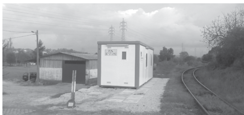
Os abrigos de Guarda de Passagem de Nível estão a ser requalificados

Nos últimos anos, e mais concretamente na Linha do Vouga, a IP tem efetuado um forte investimento na supressão de Pas-