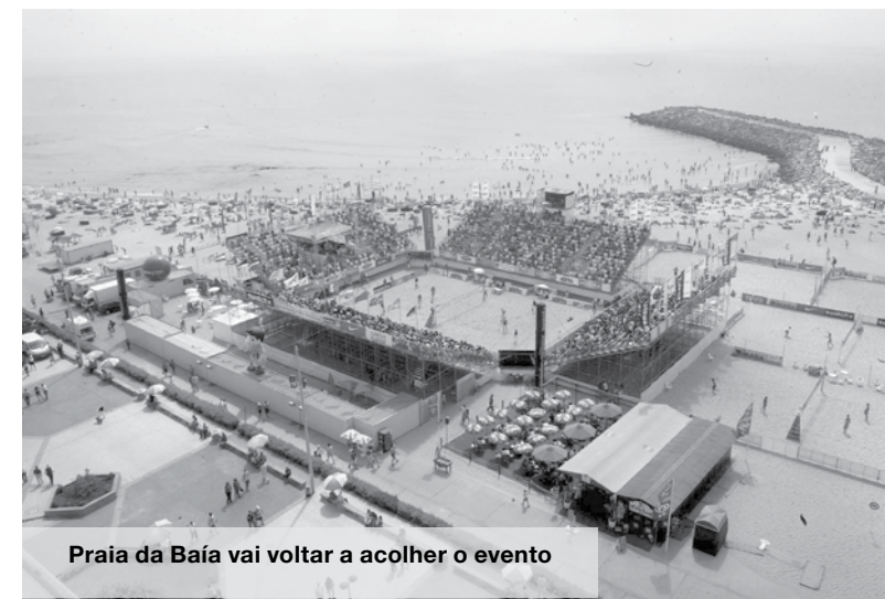
Praia da Baía vai voltar a acolher o evento

Depois do Mundialito e do Mundial de Futebol de Praia, a Praia da Baía vai voltar a acolher um evento com projeção mundial e que já fazia parte do histórico de verão da cidade. NO