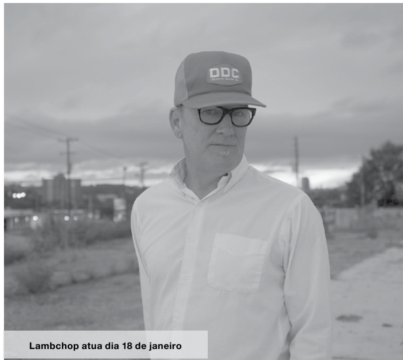
Lambchop atua dia 18 de janeiro