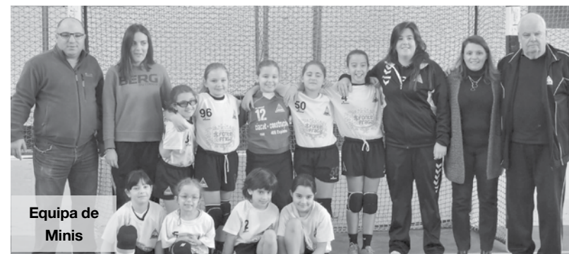
Equipa de Minis

O fim de semana desportivo da secção de andebol da AAE, começou mais cedo, no dia 8, quinta-feira, com a receção à equipa do LAAC, que não teve argumentos para bater a equipa da casa e perdeu por 41-30.