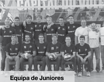
Equipa de Juniores

Juvenis: Infantis Femininos SCE 3 - Madalena 1 Iniciados Femininos SCE 3 - CAM A 2 Cadetes Femininos SCE - Toda a Prova 1 Juniors Femininos Castelo 3 - SCE 1 Juniors Masculinos CD Fiães 0 - SCE 3 NO