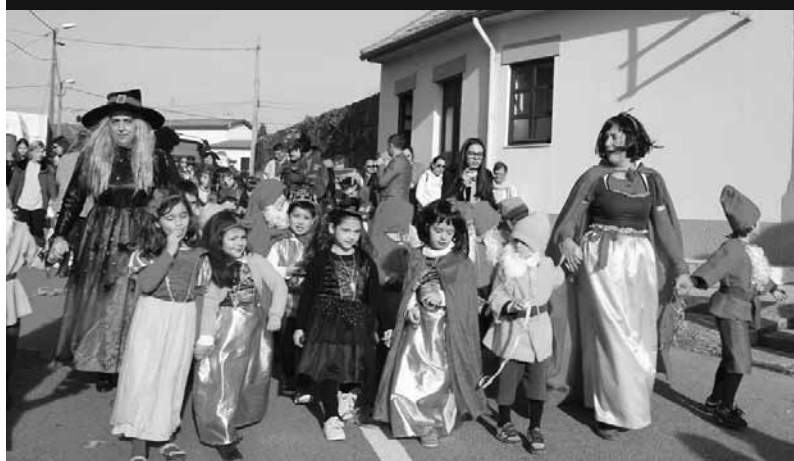
Centro Comunitário da Ponte de Anta