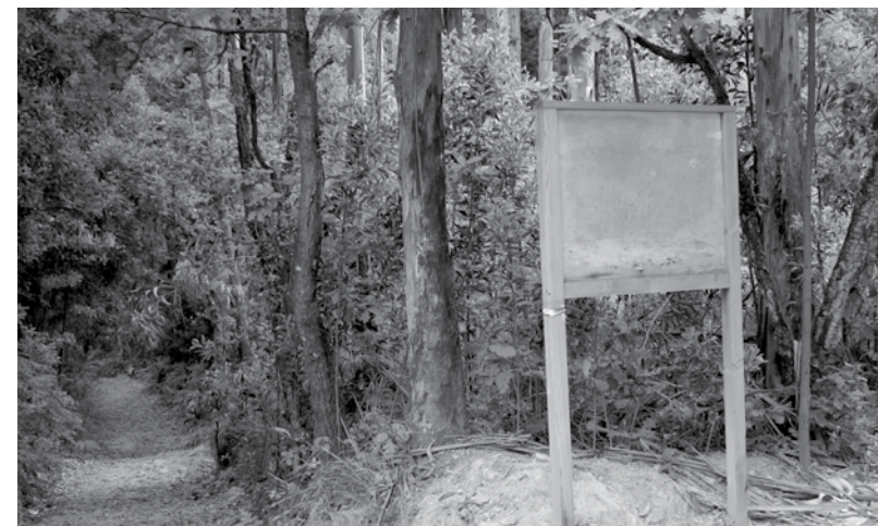
Parque da Cidade poderá ser um dos locais a intervir

A nível de mobilidade estão pensadas intervenções na Requalificação da Ciclovía da Rua 23, construção da ligação entre a Rua 24 e a Rua 32, construção da ligação entre a Rua da Nave e a Rua do Porto, construção da ligação entre a Rua Passo Velho e a Rua Prof. Dias Afonso, construção da rotunda de ligação entre a Rua 33 e a Rua do Passal, requalificação do nó entre a Rua 33 e a Rua da Guimbra, requalificação da Rua Senhora do Mar, construção da Via Pedonal entre o Complexo de Ténis e a Nave Desportiva, construção da via de ligação entre a Rua 35 e a Rua 41 e construção de passagem superior pedonal junto