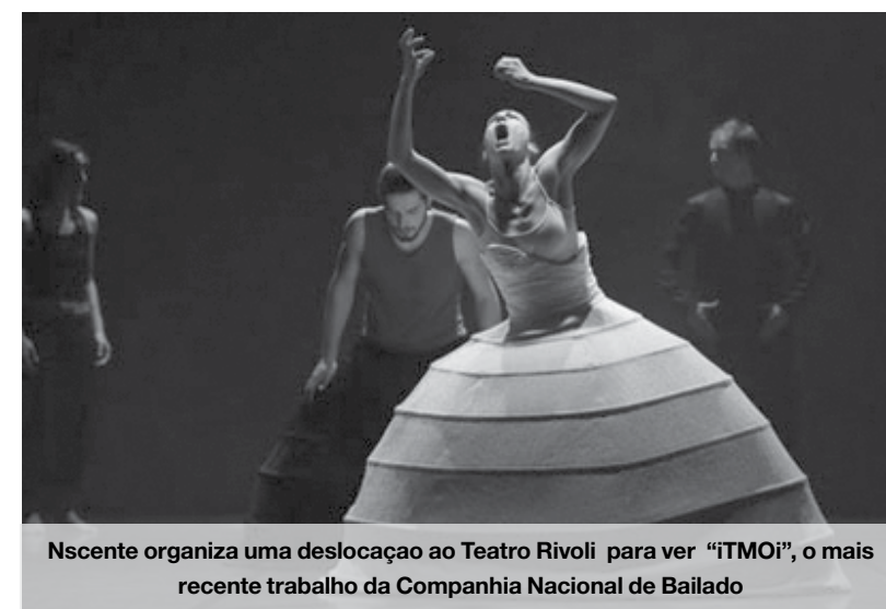
Nascente organiza uma deslocação ao Teatro Rivoli para ver “iTMOi”, o mais recente trabalho da Companhia Nacional de Bailado

Sobre este espetáculo, estreado em Lisboa há poucos dias,