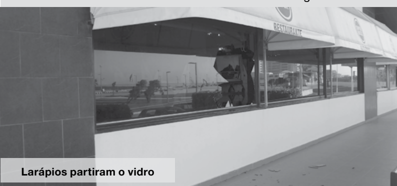
Larápios partiram o vidro

A Polícia Judiciária do Porto foi chamada e investiga o caso. PJD