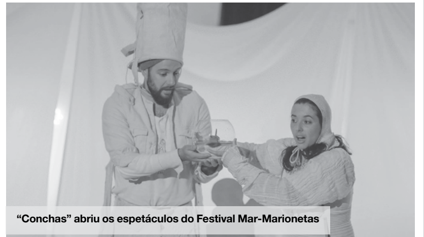
“Conchas” abriu os espetáculos do Festival Mar-Marionetas