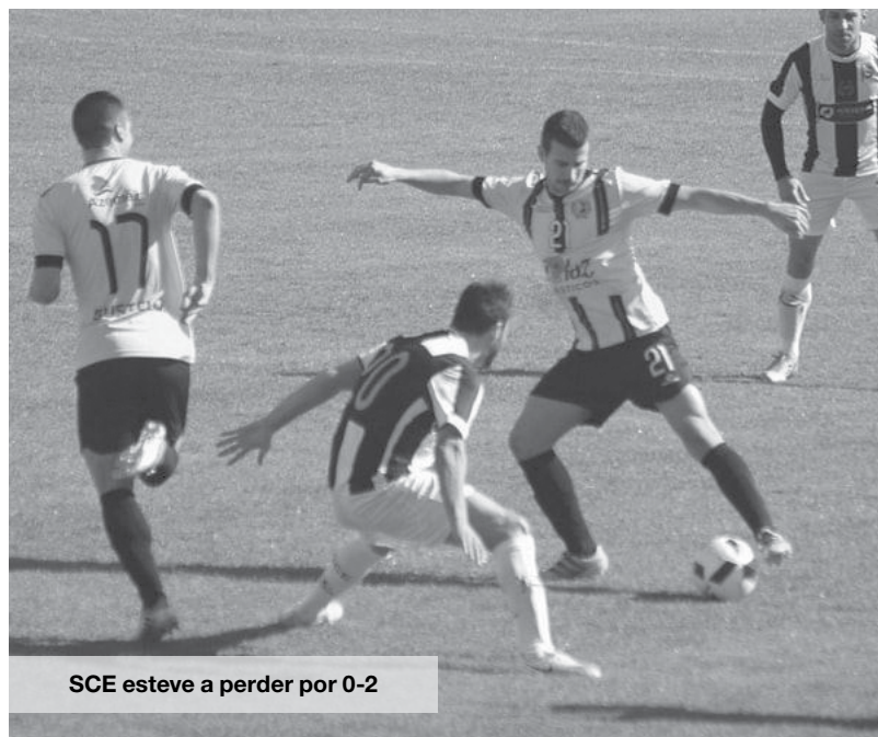
SCE esteve a perder por 0-2