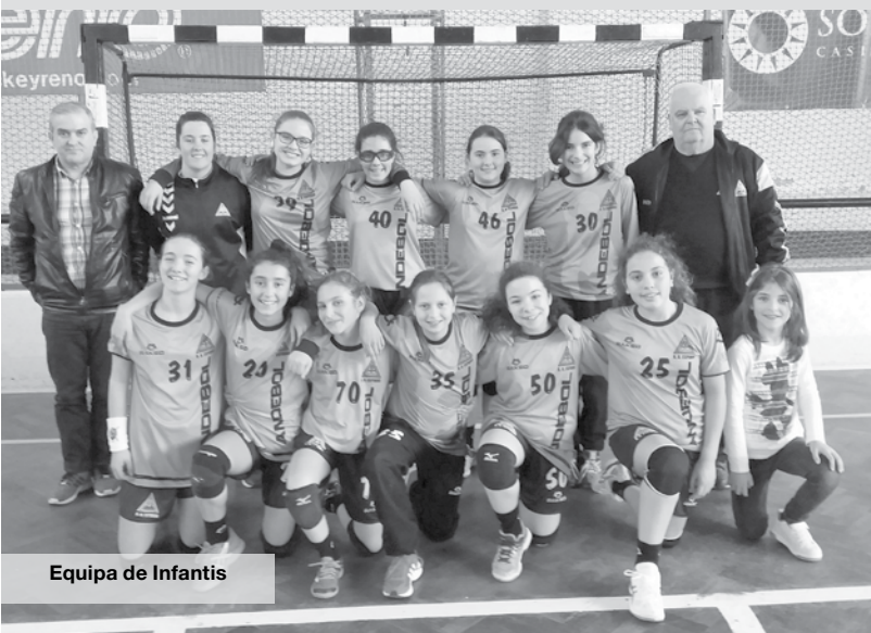
Equipa de Infantis

O fim de semana não foi bom a nível de resultados desportivos para a Secção de Andebol da Académica. No sábado a equipa de Iniciadas deslocou-se a Valongo do Vouga onde defrontou a equipa local em jogo a contar para o Campeonato Regional de Juvenis. O jogo até começou bastante equilibrado, mas a partir do minuto 15 da primeira parte a equipa da casa disparou no marcador acabando a primeira parte a ganhar por 12-7. Com o arranque da segunda parte os desacertos da equipa academista ainda se agravaram mais, acabando por perder o jogo por 29-12.