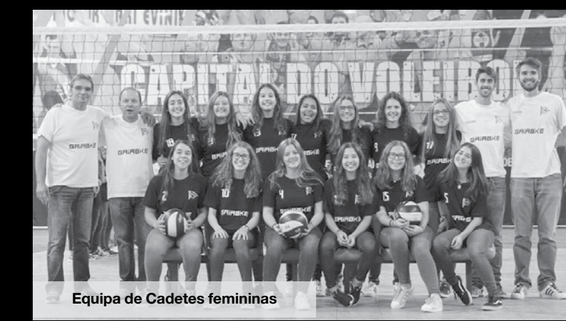
Equipa de Cadetes femininas

que a equipa da casa entrou forte e acabou mesmo por vencer o 1º set. Feitas as devidas adaptações, o grupo vareiro logo voltou o jogo a seu favor e venceu os três sets seguintes, arrecadando a vitória por 3-1. MV