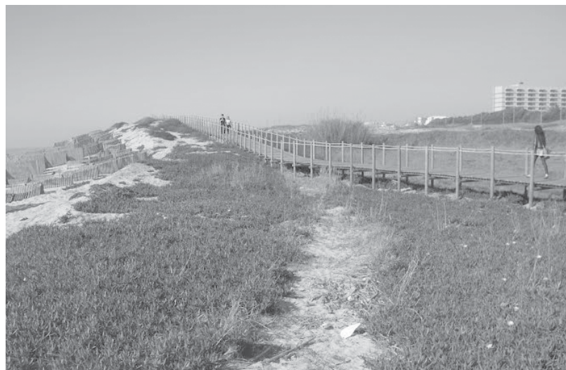
Nascente organiza um percurso a pé ao longo do passadiço de Espinho à Granja para identificação da flora dunar em pleno desenvolvimento

No calendário do mês cultural da Nascente, há de seguir-se o Nascentejazz, este ano em edição revista e melhorada, conforme se desenvolve noutra notícia, e uma nova deslocação em grupo a um espetáculo fora de portas, neste caso no Mosteiro São Bento da Vitória, no Porto, onde a 26 será apresentado o espetáculo musical “Estrada Branca”, pontuado pelas obras de Zeca Afonso e Vinícius