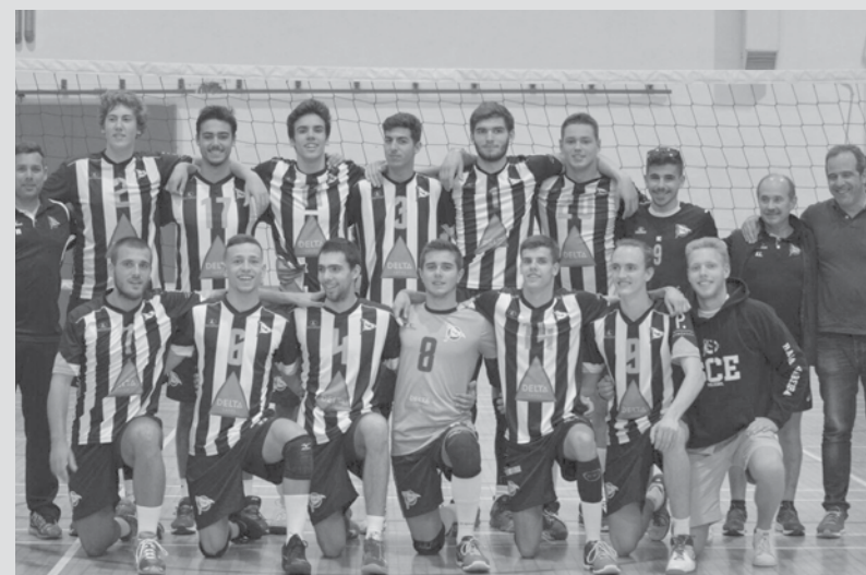
Equipa de Juniores

contudo, permitiram a recuperação do Póvoa (que chegou mesmo a liderar no marcador). Mesmo assim, a raça vareira sobrepôs-se e os pequenos espinhenses acabaram em beleza, fechando o último set com o parcial de 27-25, arrecadando assim a vitória no encontro e dando mais um passo rumo à Fase Final do escalão.