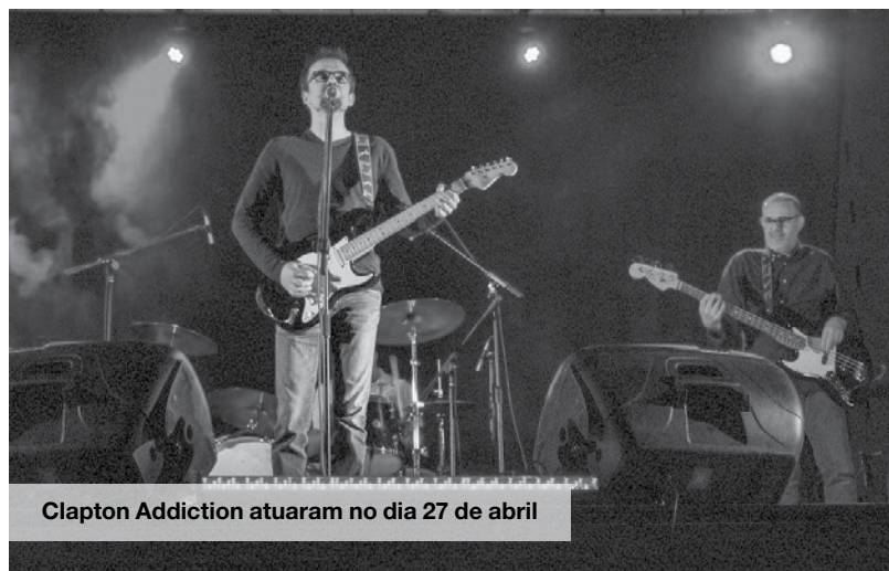
Clapton Addiction atuaram no dia 27 de abril

"Todos os concertos tiveram bastante público. O concerto da Orquestra de Jazz da Escola Profissional de Música de Espinho foi muito interessante. Estávamos quase no pôr-do-sol, com música jazz dos anos 30, num espaço arquitetónico da mesma data. Foi um sucesso!" Conta que o concerto da Orquestra Camerata da EPME, na Capela de Santa Maria