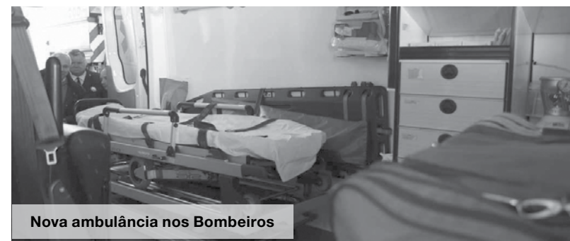
Nova ambulância nos Bombeiros

Apesar de o INEM ter agarrado que não irá encerrar “qualquer meio de emergência do instituto” na sequência do plano de reorganização do horário de funcionamento de Ambulâncias de Emergência Médica, a falta de funcionários deixa a ambulância parada das 16h00 até às 8h00. Paralelamente, os bombeiros do concelho de Espinho já têm um Posto de Emergência Médica.