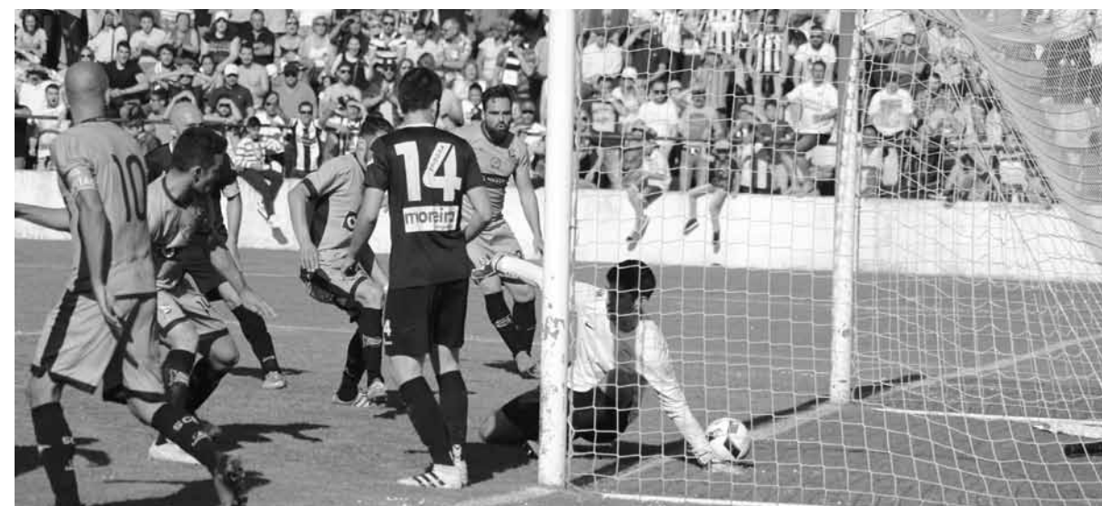
SP. ESPINHO, 3 OLIV. BAIRRO, 2

Jogo no Estádio Comendador Manuel de Oliveira Violas.