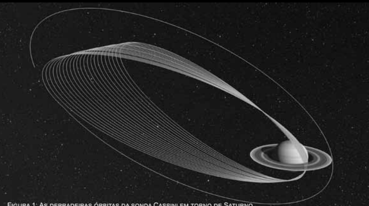
FIGURA 1: AS DERRADEIRAS ÓRBITAS DA SONDA CASSINI EM TORNO DE SATÚRNO.

Uma das surpresas foi na verdade a quase completa ausência de partículas de poeira nesta zona interna dos anéis que a sonda atravessou. As que se detectaram foram poucas e tão pequenas quanto partículas de fumo. Para além de incríveis e detalhadas imagens que se pretendem obter de Saturno, estes "mergulhos" irão também permitir mapear a gravidade e o campo magnético do planeta, por forma a aferir com maior