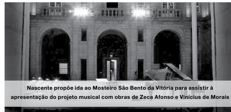
Nascente propõe ida ao Mosteiro São Bento da Vitória para assistir à apresentação do projeto musical com obras de Zeca Afonso e Vinícius de Moraes

Quanto ao outro palco a visitar este mês, vai ser uma estreia nestas saídas culturais, pois que se trata do Mosteiro São Bento da Vitória (na foto), no Porto, em cujo claustro se irá assistir à apresentação de um projeto musical assente nas obras de Zeca Afonso e de Vinícius de