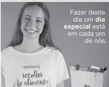
Fazer deste dia um dia especial está em cada um de nós.

Os Bancos Alimentares Contra a Fome organizam dias 27 e 28 de maio mais uma campanha de recolha de alimentos em mais de 2.000 superfícies comerciais de todo o país, com o objetivo de "levar comida a quem mais precisa". NO