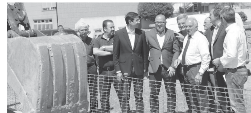
A obra avaliada em 137.163,47 euros (IVA incluído) tem um prazo de conclusão previsto para 60 dias. NO

A obra iniciou-se logo de seguida, prevendo a requalificação dos arruamentos e passeios, substituição da iluminação pública existente por luminárias de tecnologia Led, instalação de sinalização vertical e horizontal e plantação de árvores em caldeira.