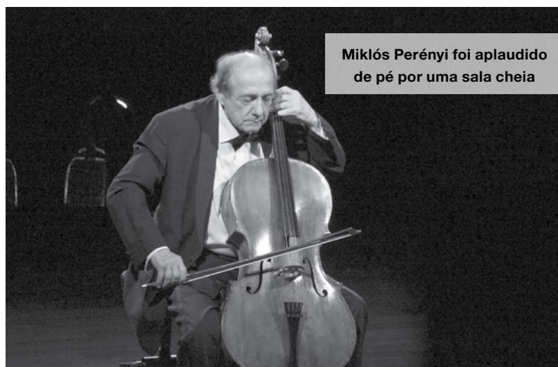
Miklós Perényi foi aplaudido de pé por uma sala cheia

Já arrancou a 43.ª edição do Festival Internacional de Música de Espinho com um concerto focado em obras de Vivaldi. A programação do evento estende-se até dia 22 de julho.