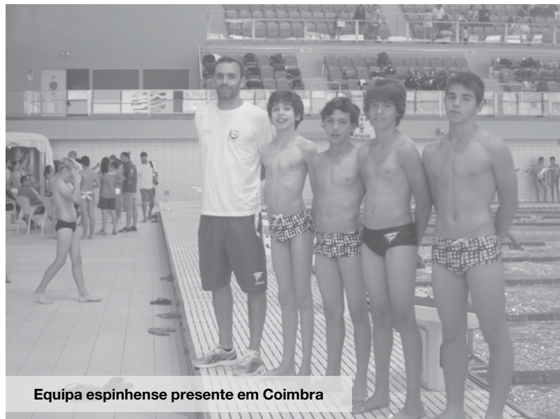
Equipa espinhense presente em Coimbra

No final da competição foram batidos 29 recordes pessoais (incluindo tempos parciais). NO