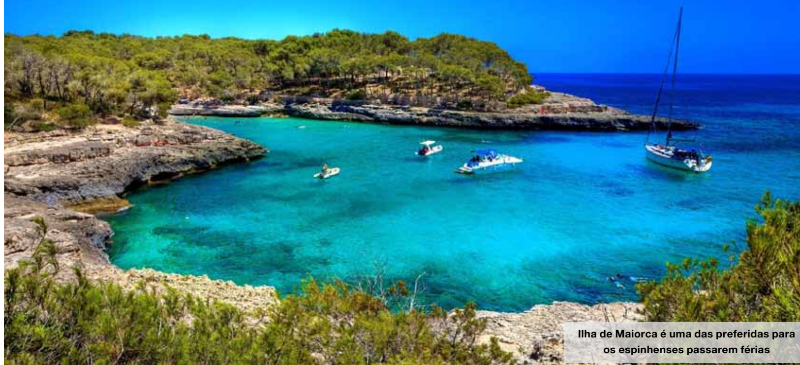
Ilha de Maiorca é uma das preferidas para os espinhenses passarem férias

Este ano há mais portugueses a planear viajar nos meses de julho, agosto e setembro. Os espinhenses mostram maior abertura para gastar dinheiro em férias. Os destinos mais procurados são as ilhas espanholas Cabo Verde e Caraíbas, a nível internacional, e o Algarve, a nível nacional.