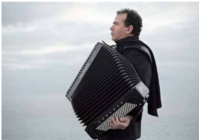
Richard Galliano atuará com a Orquestra Clássica de Espinho

Está mesmo a terminar o Festival Internacional de Música de Espinho. Depois de mais de duas semanas com espetáculos diversificados, Richard Galliano com a Orquestra Clássica de Espinho fechará o evento no dia 22 de julho, num concerto ao ar livre na Praça Dr. José Salvador.