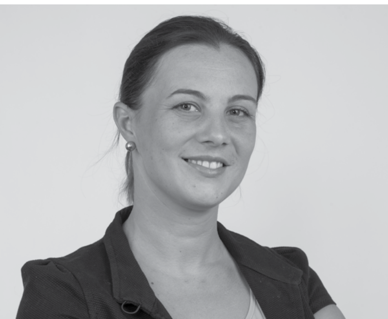
Perfil do candidato