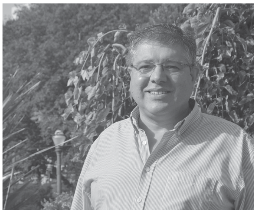
Perfil do candidato

Requalificar o Castro de Ovil, o que não vai ser difícil uma vez que já faz parte do programa da câmara municipal, e conseguir garantir a sua boa manutenção. Pretendemos ligar o castro de ovil à lagoa através do passadiço, passando pelo solar dos pintos, pelo parque Américo Magano e potenciar a sua utilização com equipamentos calisténicos, sem esquecer os equipamentos para os deficientes. Hoje,