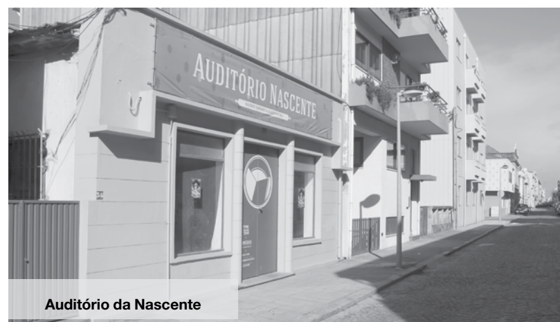
Auditério da Nascente

- Não lhe sai da cabeça aquele projeto, aquela ideia, aquele sonho sempre presente e que gostaria de