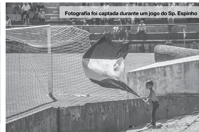
Fotografia foi captada durante um jogo do Sp. Espinho