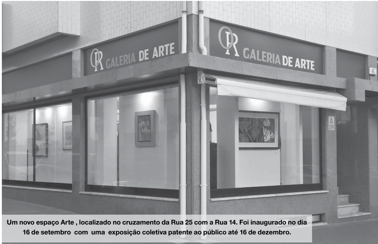
Um novo espaço Arte, localizado no cruzamento da Rua 25 com a Rua 14. Foi inaugurado no dia 16 de setembro com uma exposição coletiva patente ao público até 16 de dezembro.

Todos eles têm em comum a cultura portuguesa, a personalidade retratada em cada obra de cada artista, a energia e a lucidez de quem faz arte. Dou relevo aos artistas José Rodrigues, Júlio Resende, Jaime Isidoro e Álvaro Lapa, que já faleceram. Foram professores nas Belas Artes e todos elas dinamizaram a cultural em Portugal.