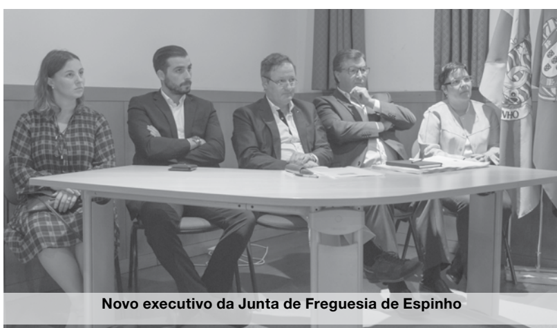
Novo executivo da Junta de Freguesia de Espinho