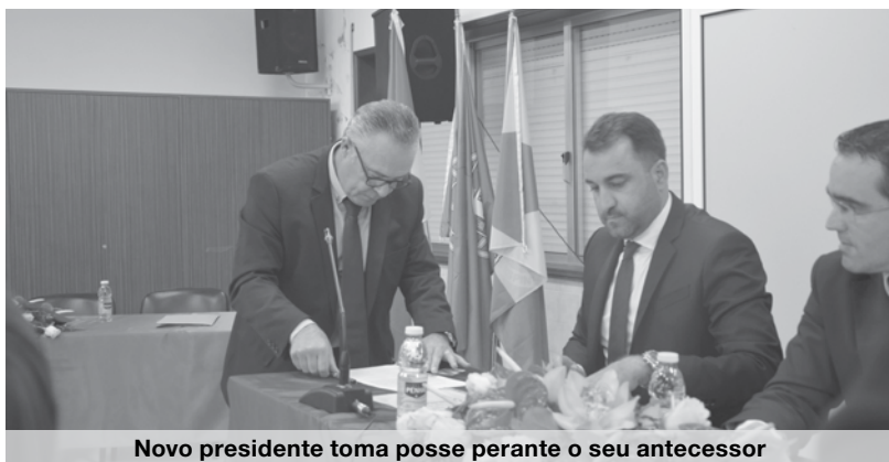
Novo presidente toma posse perante o seu antecessor