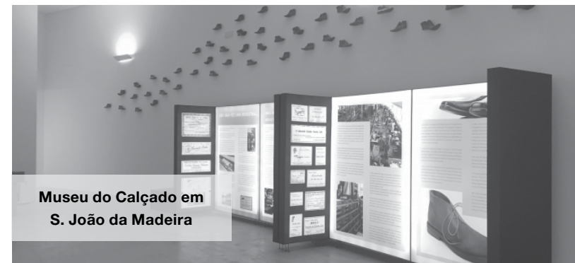
Museu do Calçado em S. João da Madeira

Quantas vezes já pensou dar um salto a S. João da Madeira para conhecer o Museu do Calçado? Se isso continua a fazer parte dos seus planos adiados, a Nascente propõe-lhe que risque esse compromisso e se inscreva no passeio cultural que está a organizar àquele museu e também ao Núcleo de Arte da Oliva.