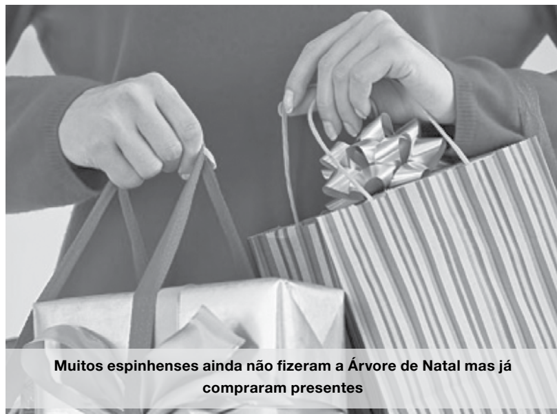
Muitos espinhenses ainda não fizeram a Árvore de Natal mas já compraram presentes

Há outro fator que leva alguns espinhenses a efetuar compras