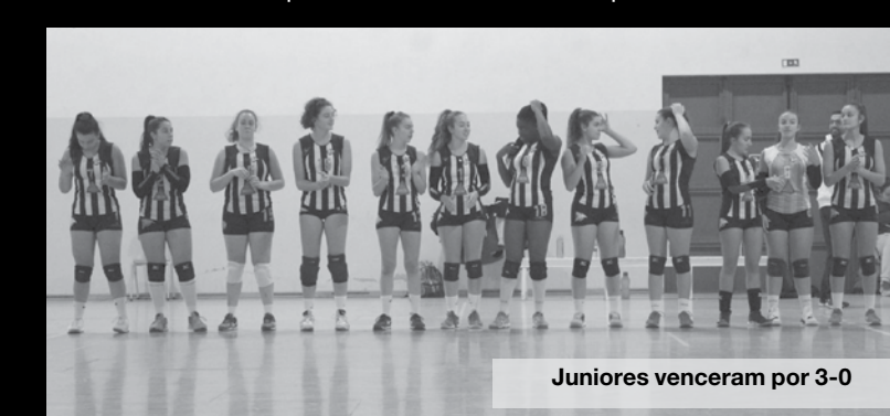
Juniores venceram por 3-0

margem máxima frente ao Viana e Ala de Gondomar, respetivamente. Para fechar a jornada em grande, os Juniores masculinos venceram categoricamente a equipa de Amares por 3-0. MV