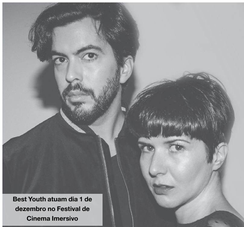
Best Youth atuam dia 1 de dezembro no Festival de Cinema Imersivo

O Festival prossegue no dia 2 logo às 11h00 com a Sessão Competitiva 4 (Rilakkuma's Planetarium, Lourinhanossaurus_