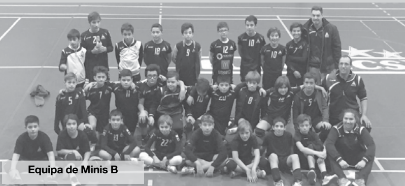
Equipa de Minis B

Os Cadetes masculinos da AAE deslocaram-se a Gueifães onde defrontaram a equipa local, vencendo por 3-0, tendo garantido o apuramento para a 2.ª fase do Campeonato Regional. Os Juvenis masculinos receberam a Associação Desportiva de Amarante, tendo vencido a partida por 3-0 sem grandes dificuldades. No domingo os juniores masculinos foram à Nave Desportiva de Espinho defrontar o Sporting Clube de Espinho, perdendo por 3-0. Os mochinhas participaram no domingo na 2.ª mão do Torneio de Natal dos Mini B masculinos Zona 3 organizado pelo Ala Nun'Alvares de Gondomar, repetindo a competição entre as 7 equipas que já tinham competido há 2 semanas atrás. As equipas da Associação Académica de Espinho conquistaram o 2.º lugar (Equipa A), 3.º lugar (Equipa B) e 5.º lugar (Equipa C). MM