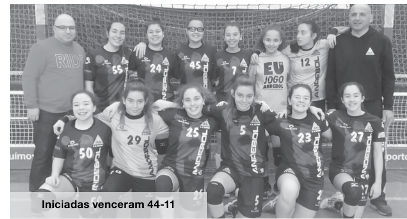
Iniciadas venceram 44-11

A última equipa a entrar em campo foi as Juniores que se deslocaram a Baltar em jogo a contar para a