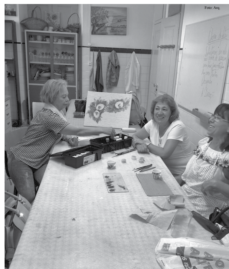
As aulas de Pintura fazem parte do programa letivo da Universidade Sénior de Espinho