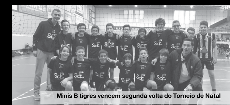
Minis B tigres vencem segunda volta do Torneio de Natal

suas adversárias: Porto Vólei e Fiães respetivamente. Embora as Iniciadas B não tenham conseguido pontuar contra a equipa do Porto Vólei, quebrando o "pleno de vitórias" no feminino, as Infantis fecham a jornada em grande com uma importantíssima vitória sobre a equipa da Póvoa por 3-0.