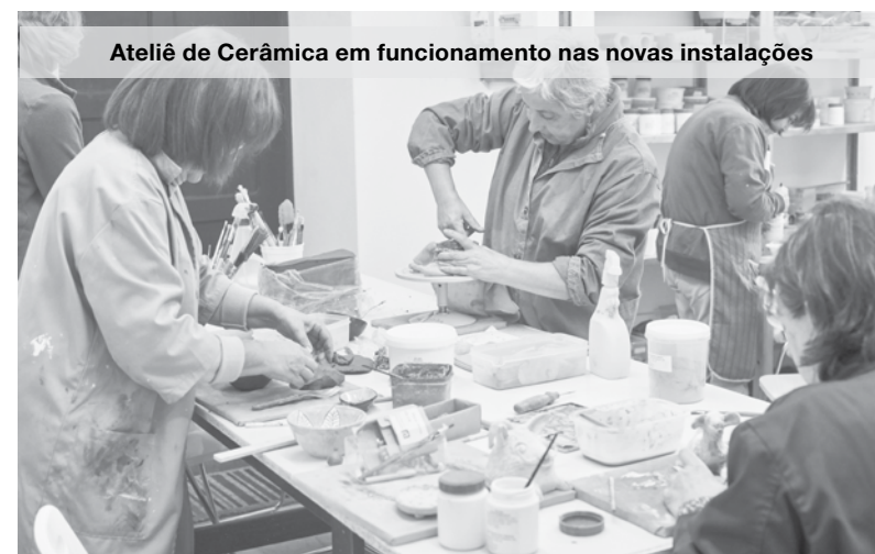
Ateliê de Cerâmica em funcionamento nas novas instalações

ao yoga, verificou-se recentemente um reajustamento horário, pelo que esta modalidade funciona agora às quintas-feiras, das 19:15 às 20:45. MV