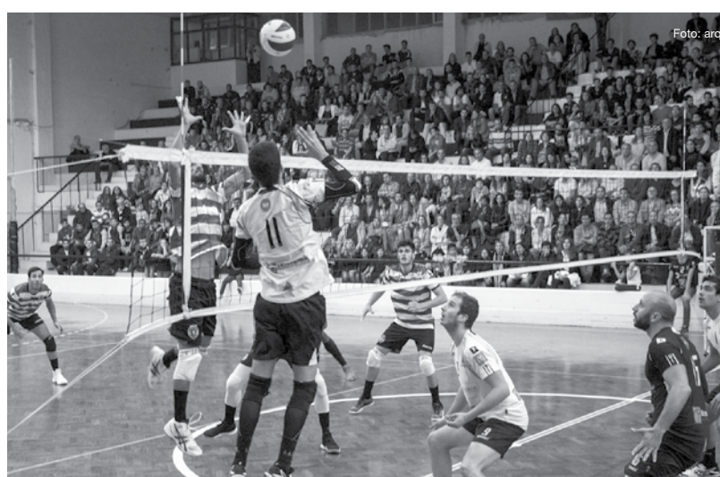
os oitavos de final, os mochos venceram por 1-3 (23-25, 22-25, 25-23 e 23-25) NO

Em relação à Taça de Portugal, a AAE deslocou-se a Vila do Conde para defrontar a turma local. No encontro a contar para