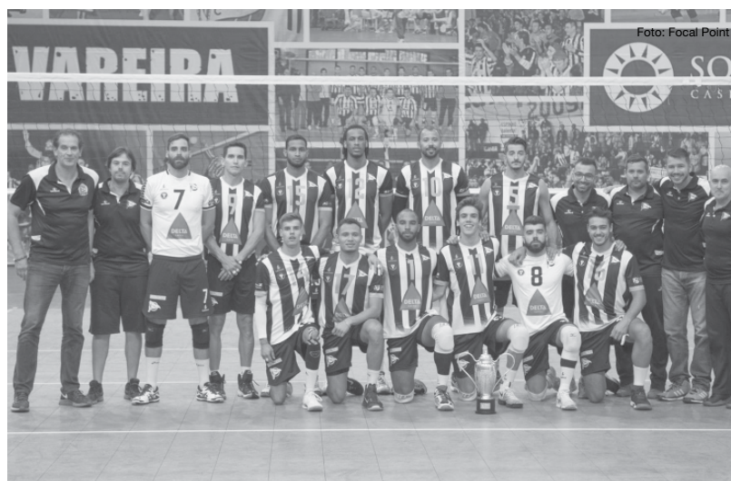
último set. No próximo sábado, o SCE recebe o SL Benfica às 17 horas. MM

Os tigres, que, no papel, atuavam como visitantes, embora na realidade o jogo se realizasse na Arena Tigre, tiveram sempre o jogo controlado, mas ainda sentiram a réplica do rival no terceiro e