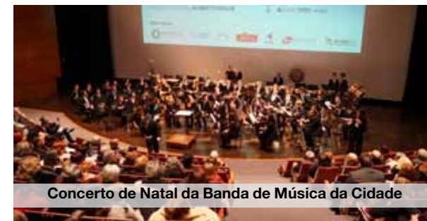
Concerto de Natal da Banda de Música da Cidade

No domingo, às 15h00, haverá mais uma animação de rua, desta vez no Largo da Câmara, pela Orquestra Zabadum. JA