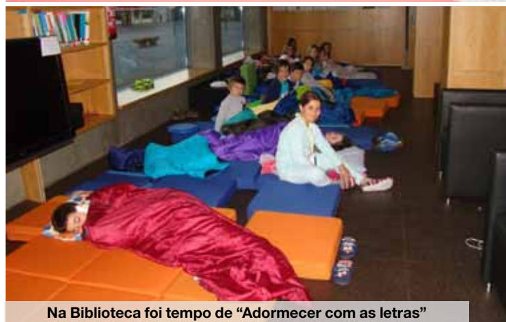
Na Biblioteca foi tempo de “Adormecer com as letras”

A animação do serão de dia 8 de dezembro esteve a cargo da Banda de Música da Cidade de Espinho, que teve o seu Estágio/Concerto de Natal a acontecer no Centro Multimeios. O concerto foi o resultado do trabalho desenvolvido pela BMCE durante o estágio. A direção artística foi da respon-