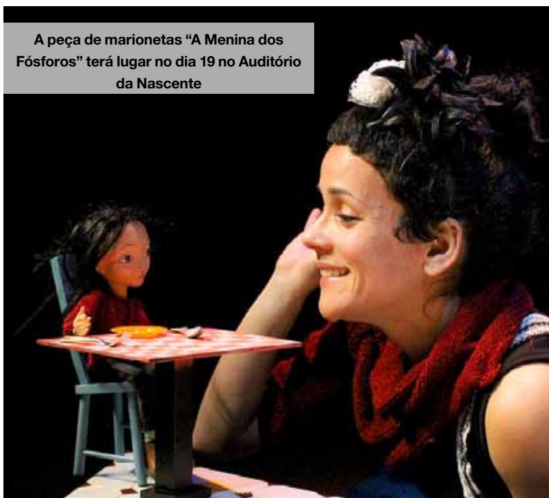
A peça de marionetas “A Menina dos Fósforos” terá lugar no dia 19 no Auditório da Nascente