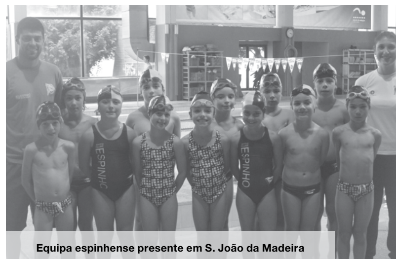
Equipa espinhense presente em S. João da Madeira

Também em destaque estiveram as estafetas espinhenses