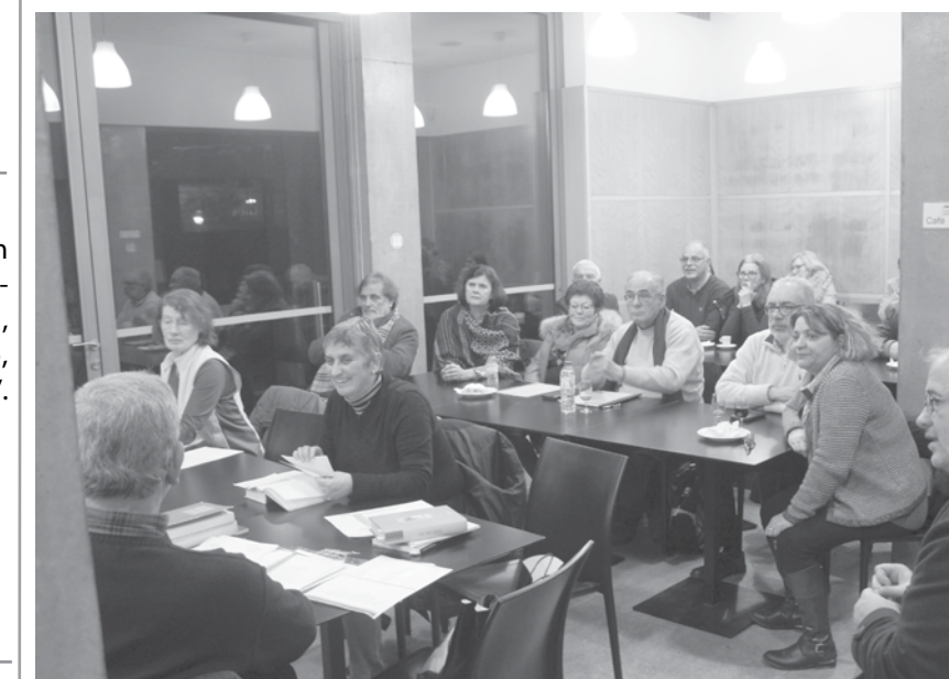
Onda Poética registou mais uma casa cheia na semana passada.

malmente as sessões acontecem na cafeteria. As sessões especiais têm lugar no auditório. Temos um público mais ou menos fiel que já preenche um pouco a sala, mas aparecem sempre pessoas para ouvir ou para ler poemas seus. O sítio parece-me ótimo e ajuda a atrair visitantes, também por ser central. Temos sempre o apoio da direção e dos colaboradores e estamos muito satisfeitos”. JA