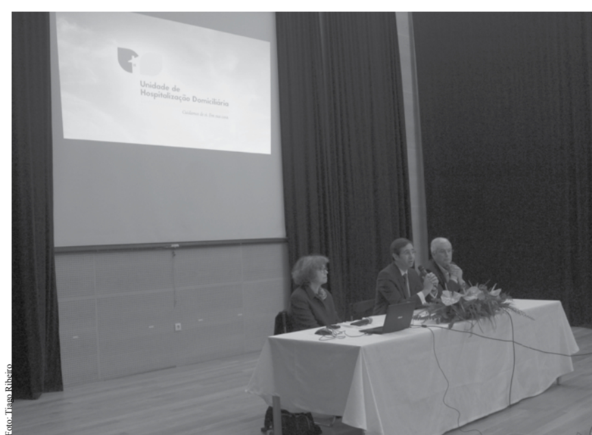
Apresentação da Unidade de Hospitalização Domiciliária decorreu no FACE.