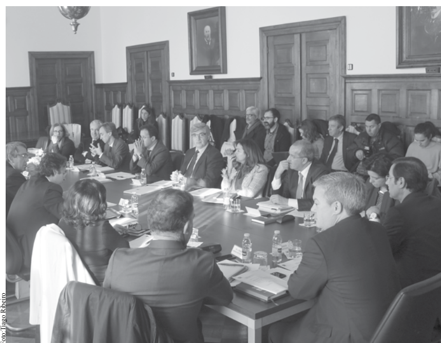
Reunião teve lugar no Salão Nobre da Câmara Municipal de Espinho.

e prospetiva às faixas de Gestão de Combustível Florestal. Mostraram-se preocupados com a grande quantidade de incêndios e com a possibilidade de virem a ser responsabilizados devido à legislação agora publicada. “Daqui a quatro anos a culpa será dos presidentes da Câmara e nós estamos todos muito mansos”, comentou o presidente Câmara da Trofa. Salientaram, assim, a importância de proceder com urgência à limpeza de terrenos.