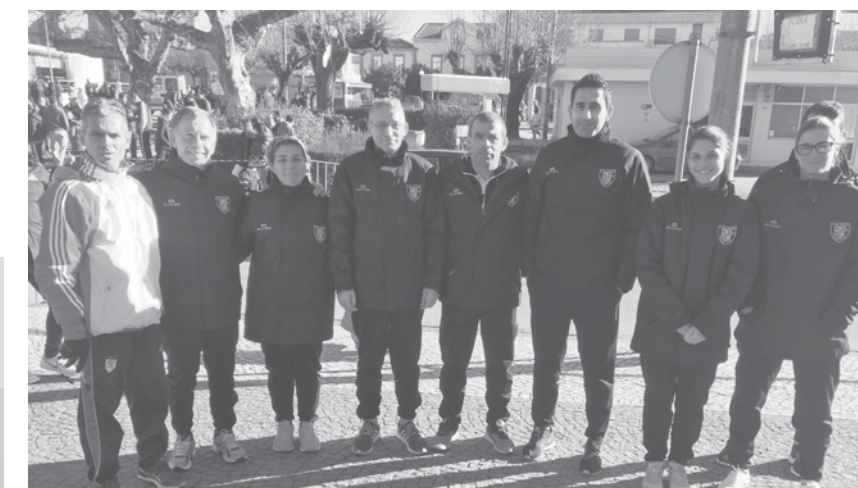
Equipa do GD Ronda que marcou presença em Cesar.

Em Cesar, no 14.º Grande Prémio de Atletismo daquela vila do concelho de Oliveira de Azeméis, o GD Ronda esteve representado com oito atletas (três mulheres e cinco homens).