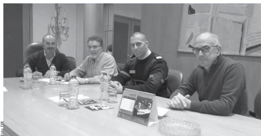
Protocolo foi assinado no passado dia 24 de janeiro.

"Este protocolo vai permitir que colaboradores deste Grupo recebam formação em áreas importantes como primeiros socorros, segurança contra incêndios, procedimentos de prevenção e procedimentos de emergência. Será ainda prestado apoio na preparação, assim como a participação ativa, em simulacros abrangidos pela área de segurança contra incêndios em edifícios" explicam os Bombeiros acrescentando que o