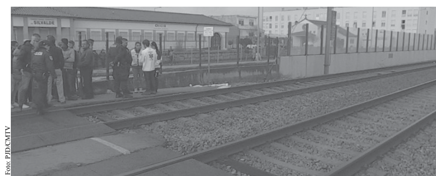
Os Bombeiros do concelho procederam à recolha do cadáver.

construída uma passagem aérea a norte no Rio Largo. Por imperativos de segurança e pelo grau de sinistralidade na Passagem de Nível do Bairro Piscatório, É da mais elementar justiça que essa passagem superior pedonal, seja já em primeiro lugar construída no bairro piscatório, exigimos que assim seja". O texto termina com um pedido de desculpas à família da silvaldense que faleceu e de tantas outras famílias que passaram pelo mesmo infortúnio: a autarquia de Silvalde pede desculpa pela inércia política e apresenta a todos os seus sentidos pésames". NO