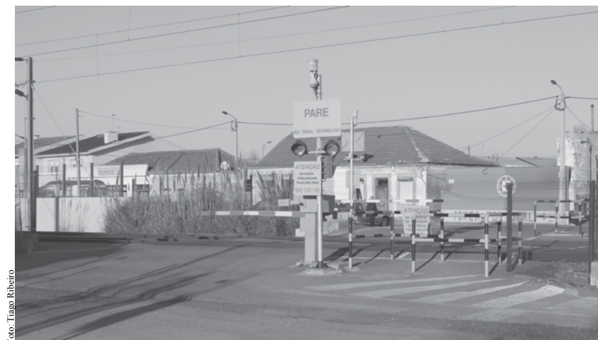
Passagem onde aconteceu o acidente fatal para a silvaldense.

ta mais determinação as passagens desniveladas. Senhor presidente é necessário marcar já uma reunião com as Infraestruturas de Portugal. Exigimos já as passagens, tanto a superior como a inferior. Passaram oito anos, é muito tempo. As suas promessas foram claras senhor presidente. Com o povo da Marinha de Silvalde, não se brinca, as suas promessas, não passaram de letra morta".