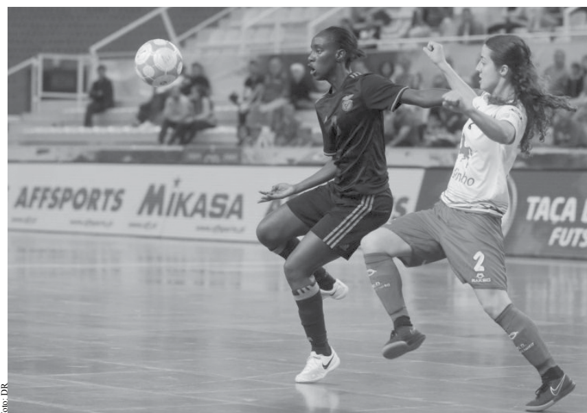
Novasemente e SL Benfica medem forças dia 24 de fevereiro

CALENDÁRIO (1ª VOLTA - FASE DE APURAMENTO DE CAMPEÃO) 1ª JORNADA (3 fevereiro) CR Nun'Álvares - NOVASEMENTE GD 2ª JORNADA (10 fevereiro) NOVASEMENTE GD - Sporting CP MV