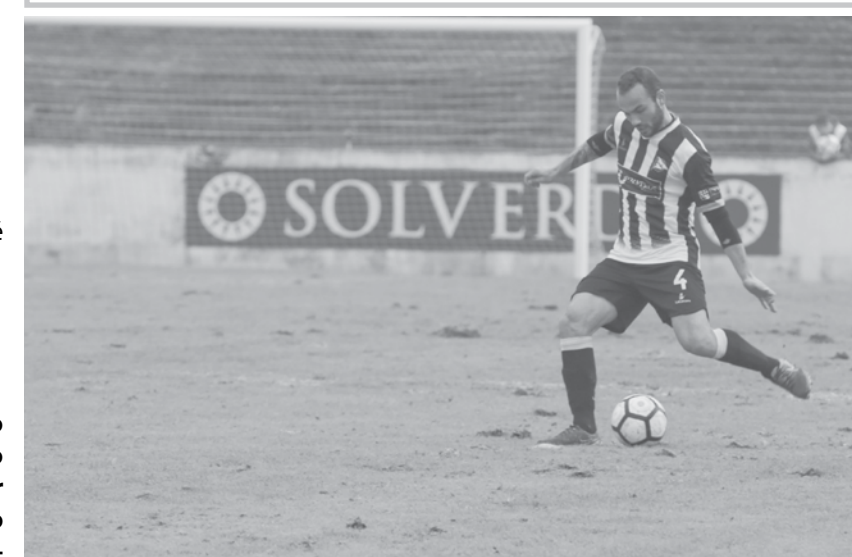
Tigres voltaram a perder terreno no topo da tabela

nem engenho para ultrapassar este resultado menos conseguido com excepção de um golo anulado por fora de jogo de Bruno Moraes.