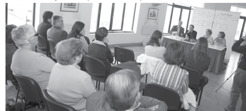
Biblioteca funcionou durante alguns anos no Salão Nobre da Piscina.

por acaso. Eu cheguei a oferecer livros e a dar sugestões para que comprassem determinado tipo de publicações. Era um espaço acolhedor, soalheiro e com uma vista lindíssima do mar que banha Espinho”. JA