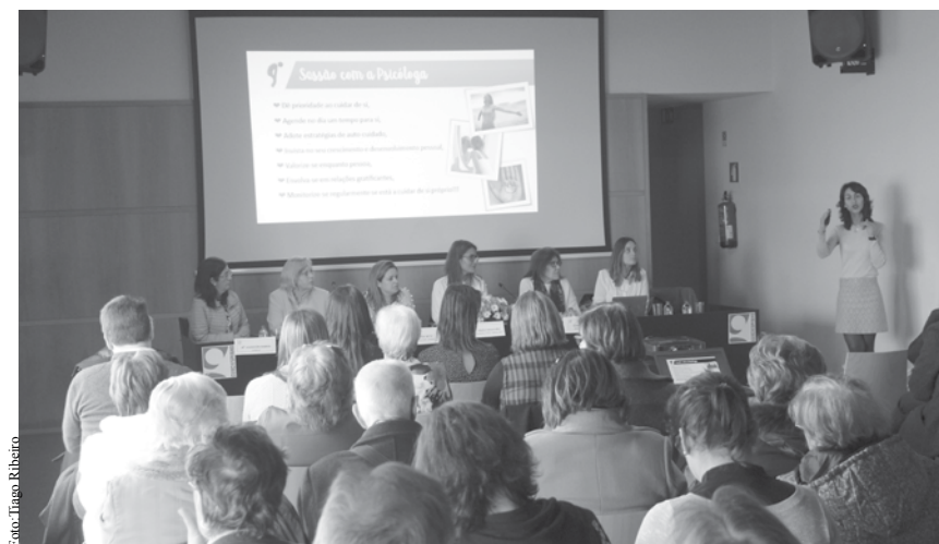
Sessão promovida pela Cerciespinho teve casa cheia.

N o passado dia 22 de fevereiro, a Cerciespinho organizou uma Sessão Pública dirigida a cuidadores de pessoas com dependência no âmbito do Projeto "Capacitar Mais" - premiado pelo BPI Seniores 2017, na Biblioteca Municipal José Marcelo Silva.