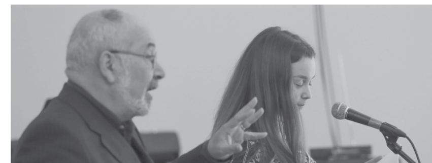
Francisco Moita Flores em conversa na Escola Sec. Manuel Gomes de Almeida.