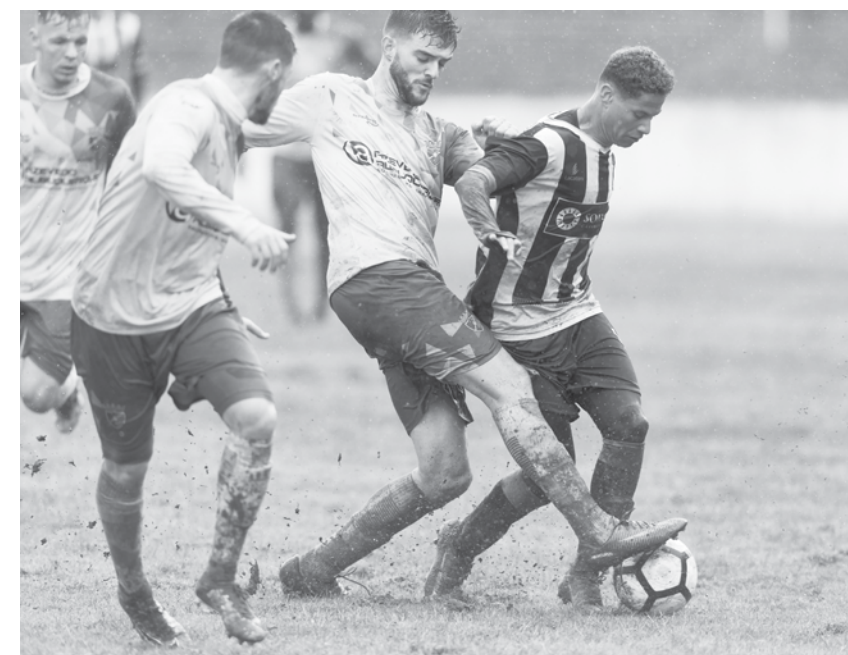
Mesmo com um relvado massacrado os tigres conseguiram vencer.