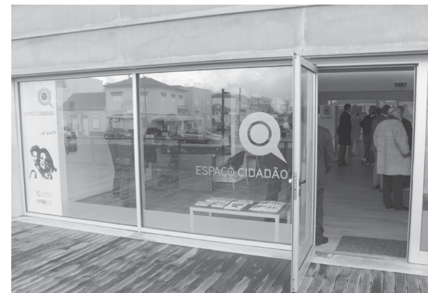
Espaço do Cidadão no FACE foi inaugurado na segunda-feira passada.

Ainda no decorrer de 2018, a freguesia de Paramos contará também com um Espaço do Cidadão, que será instalado nas antigas instalações da Escola da Bouça. Deverá servir, não só a freguesia de Paramos, como também a parte mais a nascente da freguesia de Silvalde. "Penso que com estes três Espaços do Cidadão, com a Câmara Municipal e, creio eu, futuramente também com o primeiro piso do