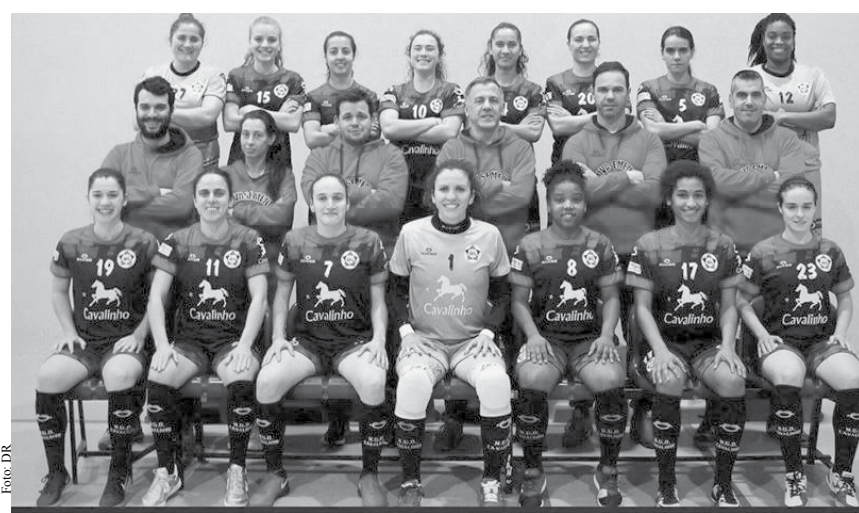
Novasemente venceu o Golpilheira por 1-2.

Para a semana há jogo em Cassufas frente ao Vermoim. NO