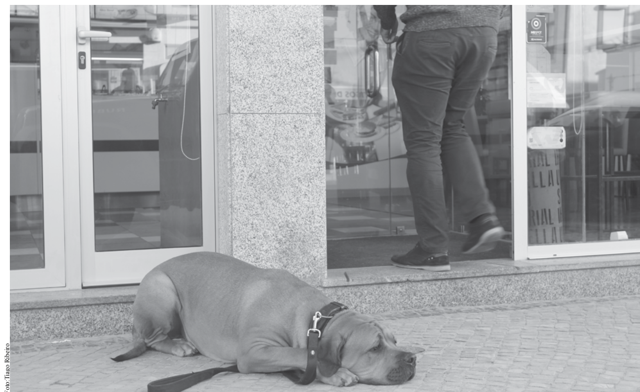
A partir de maio pode levar o seu cão ao restaurante desde que o estabelecimento o permita.

O restaurante Graciosa ainda não decidiu se vai permitir a entrada de animais: "ainda não tomamos