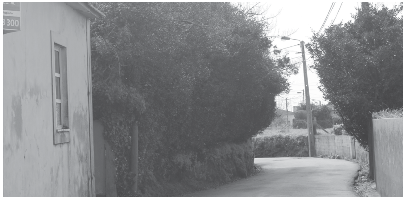
A limpeza dos terrenos ainda não chegou a todo o lado.

O s proprietários têm até quin-ta-feira para limpar as matas junto ao património edificado. A partir dessa data, arriscam-se a pagar multas que podem chegar aos 120 mil euros. A Câmara Municipal de Espinho está a executar um conjunto de medidas com o objetivo de prevenir os incêndios no concelho. Por sua vez, os presidentes das Juntas de Freguesia têm vindo a ouvir comentários de preocupação por parte da população. Por esse motivo, as Juntas de Freguesia estão a adotar medidas de sensibilização e a localizar os proprietários dos terrenos.