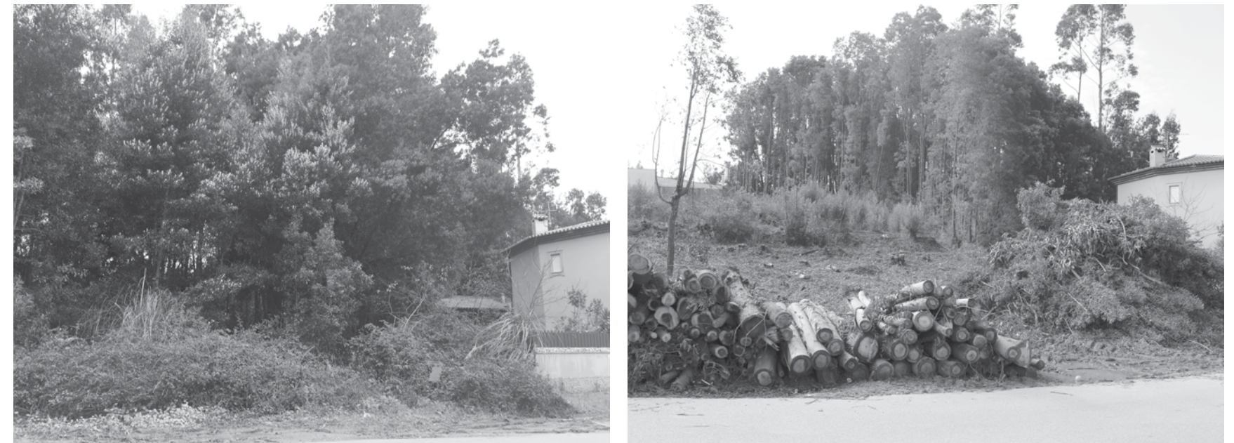
O antes e o depois. As duas fotos mostram as diferenças após as limpezas do terreno efetuadas pela autarquia na Rua do Paço Velho em Anta.