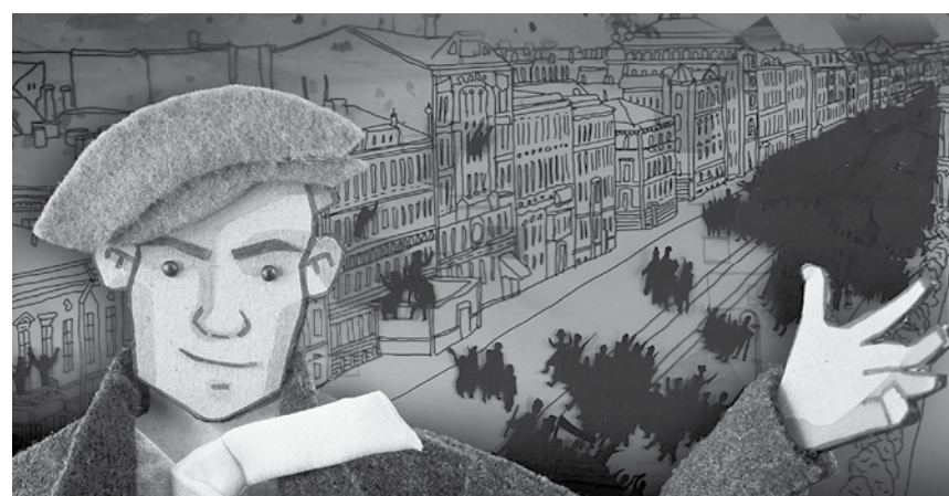
Dia 25 será exibido o filme "1917-O Verdadeiro Outubro".

ciclo "Ficção e Realidade" é grátis, o que facilita a oportunidade de assistir a bom cinema de animação