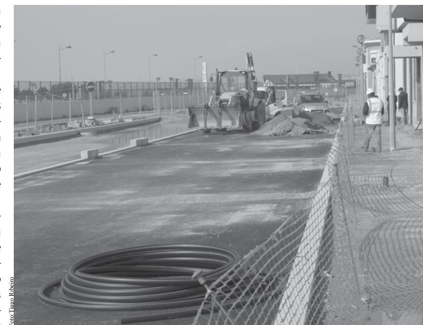
Rua 8 já recebeu alcatrão mas o pavimento ainda não é definitivo.

Recorde-se que a Câmara Municipal de Espinho, disponibiliza um serviço de apoio ao munícipe para alertas e registo de ocorrências. Para tal os moradores deverão enviar correio eletrónico com as suas dúvidas, sugestões ou observações para o endereço: obras@cm-espinho.pt. NO