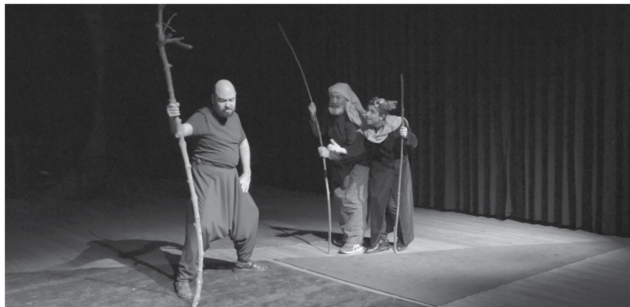
Nova peça pelo Teatro Popular de Espinho há muito que está a ser ensaiada.

“A Paz” é uma peça composta por duas partes de 45 minutos. De