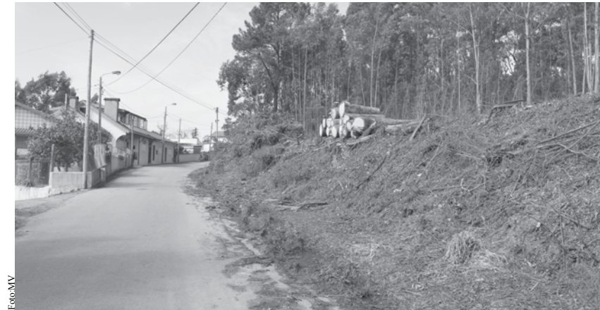
Alguns terrenos já foram limpos.

Todos os anos o Sistema de Defesa da Floresta Contra Incêndios prevê um conjunto de medidas a executar para prevenção de incêndios. A execução de faixas de gestão de combustível, em particular as da rede viária que confinam com espaços florestais, previamente definidos no Plano Municipal de Defesa da Floresta Contra Incêndios, é uma das medidas. A