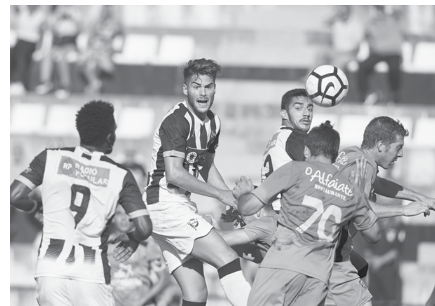
Tigres voltaram da Madeira com três preciosos pontos.

A equipa da Camacha balanceia-se entre a zona de despromoção e a permanência. Se perdessem o encontro voltavam aos lugares da descida. Do outro lado, o Sp. Espinho sabia que precisava de vencer o encontro para continuar a depender apenas de si próprio para acabar o campeonato no topo. Assim, foi uma partida intensa que se viveu no Complexo Desportivo da Camacha. No sintético, a turma da casa entrou melhor na partida mas aos poucos os vareiros foram equilibrando. Os lances de perigo