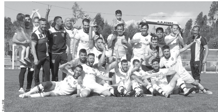
GD Ronda sagrou-se campeão da primeira divisão.

O fim de semana também foi de festa em Anta, mais concretamente em Esmojães. A Associação, venceu a AD Lomba por 2-0 e aproveitou os desaires do Guetim, Morgados e Cruzeiro para festejar a conquista do título e subida à primeira divisão. NO