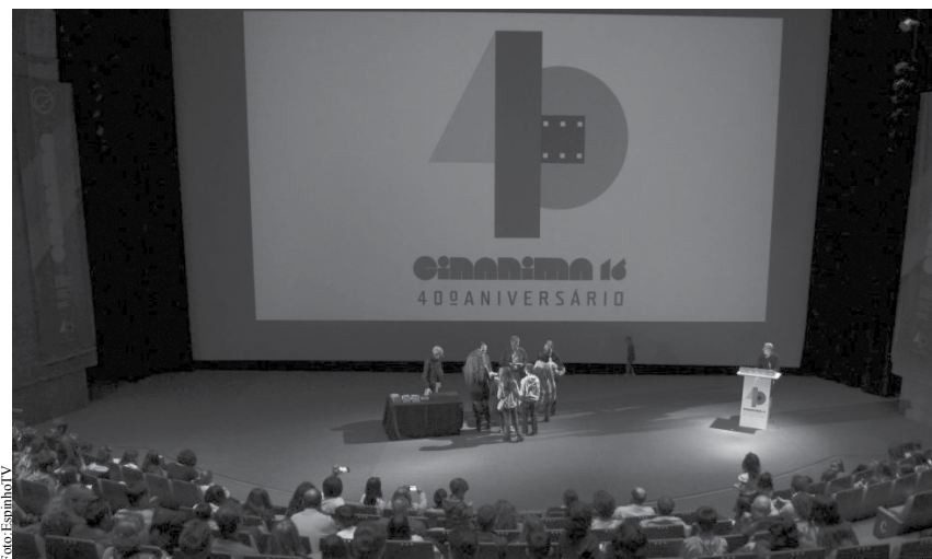
Em 2016 o CINANIMA celebrou o 40.º aniversário.

Em carta recentemente enviada ao Ministro da Cultura, a Câmara Municipal de Espinho, através do seu presidente e vereador da cultura, e na qualidade de coorganizadora do CINANIMA, expressou o seu protesto e preocupação pela redução do apoio que o ICA - Instituto do Cinema e Audiovisual vem concedendo a este festival espinhense de cinema de animação, de que a Cooperativa Nascente foi