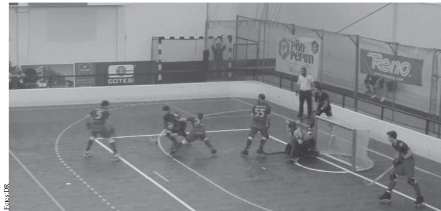
Mochos continuam no 4.º lugar da tabela.

Para a semana, a 29ª jornada será disputada no dia 26 de maio, no Pavilhão Arquiteto Jerónimo Reis, frente à equipa do HC Fão, atual penúltimo classificado. NO