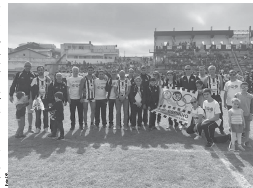
Secção de atletismo do SCE presente no adeus ao Estádio Comendador.