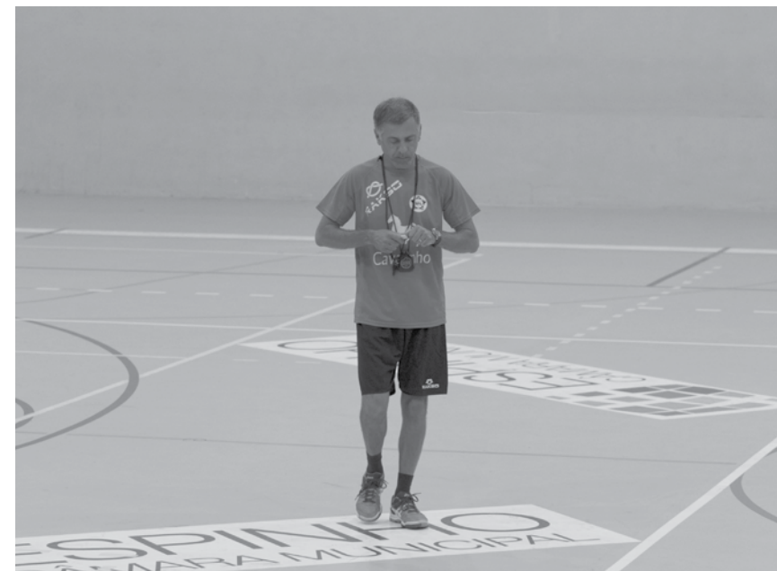
Técnico antense foi convidado para renovar mas declinou convite.