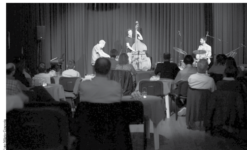
3.ª Edição do NascenteJazz voltou a ser bem acolhida pelo público.