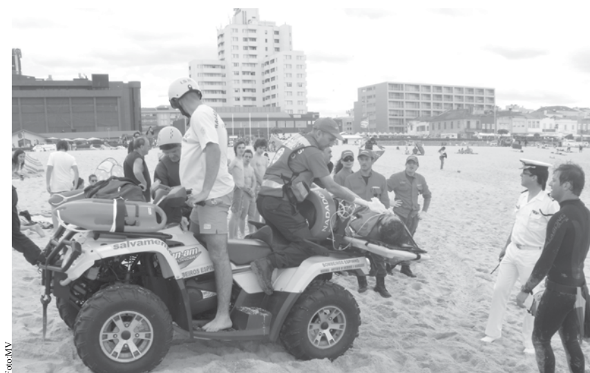
Bombeiros alegam que o ISN não disponibiliza a moto quatro.

A Autoridade Marítima Nacional rejeitou as acusações dos Bombeiros do Concelho sobre falta de meios para socorro balnear, afirmando ter veículos de apoio em manutenção e que não há motivo para preocupações.