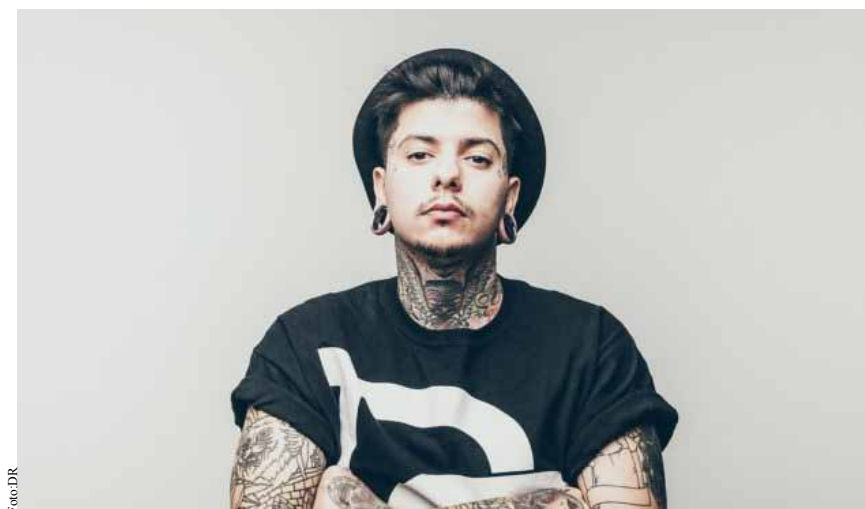
Agir vai atuar no dia 11 de agosto.

Embora ainda não tenha sido confirmado oficialmente, o Maré Viva apurou que Miguel Araújo deve entrar também no cartaz do Festival OITO24 deste ano.