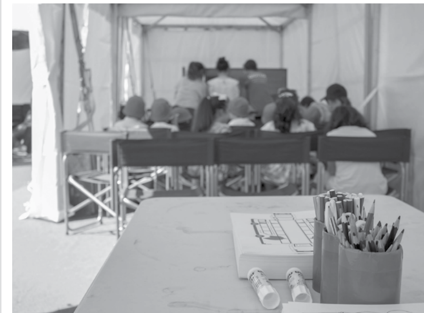
O Festival também pensou nos mais novos com atividades perto da praia.