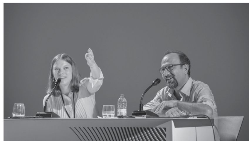
Asgar Farhadi durante a Masterclass.

O Lince de Ouro para melhor longa-metragem de ficção do FEST - Festival Novos Realizadores Novo Cinema foi entregue ao filme "Lemonade", realizado pela romena Ioana Uricaru. Sessões com Asgard Farhadi e Roman Coppola tiveram sessão esgotada.