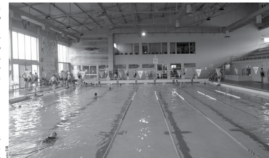
Monitor dava aulas na Piscina Municipal de Espinho.

O Maré Viva falou com os pais de alguns alunos do monitor e a maioria encontrava-se em estado de choque. "Soubemos a notícia na sexta-feira passada e fiquei em estado de choque quando soube quem era o professor. O meu filho foi aluno dele e honestamente nunca vi nada que me preocupasse. Tive sempre a sorte de assistir às aulas mas não consigo deixar de pensar que pode ter havido algum toque ou abuso ligeiro. Estou enojado e revoltado", contou-nos um pai que optou por não se identificar. "Pessoas que fazem isto a crianças são doentes e não merecem viver em sociedade desta maneira. Não quero imaginar sequer se houve algum contacto pois sou capaz de não responder por mim.