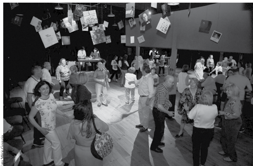
presentes visivelmente apreciaram. Claramente, mais um caso em que não deverá haver duas sem três.

O segundo evento "Dançar com Vinil" animou o Auditório Nascente no fim de semana passado e não desmereceu em nada o primeiro: boa música dos anos 60 a 80, uma dupla de DJs plena de bom gosto e boa onda, e um público que não se fez rogado e acorria à pista a cada início de canção conhecida. E foram muitas, de tantos "convidados especiais" que justificaram plenamente a ocasião, chamem-se eles Roy Orbison, Aretha Franklin, Rod Stewart, Dire Straits, António Variações ou Salada de Frutas. Entre os passos de dança e uns momentos de convívio à mesa ou no bar, a noite decorreu animada e amigável, num ambiente de convívio e boa disposição que os