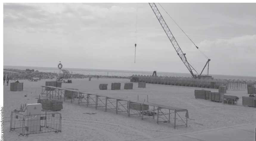
Estádio já está a ser montado.

Recorde-se que a assinatura do protocolo para a realização destes eventos foi assinado em maio e contou com a assinatura do presidente da Câmara Municipal de Espinho e do vice-presidente da Federação Portuguesa de Voleibol. NO