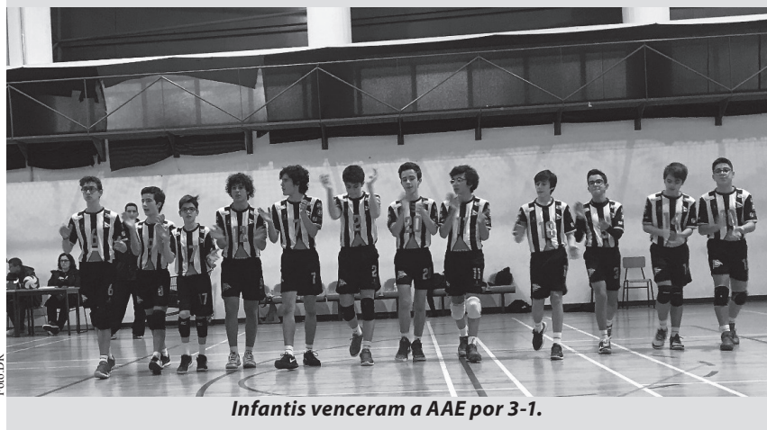
Infantis venceram a AAE por 3-1.