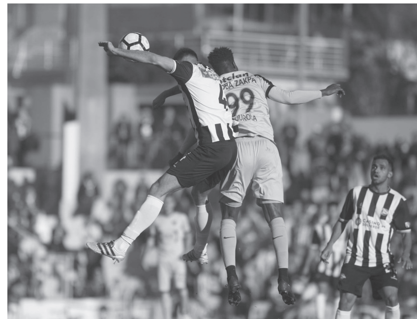
Tigres não conseguiram marcar nenhum golo.

Jogo no Estádio do Lusitânia de Lourosa.