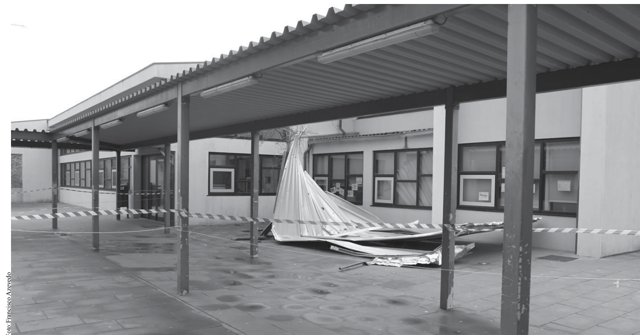
Parte da cobertura do pavilhão que não resistiu às fortes rajadas de vento.

Segundo Ilídio Sá, as aulas não seriam retomadas naquele dia e no local estiveram os Bombeiros do Concelho de Espinho e outros elementos da Proteção Civil a avaliar a estabilidade geral do edifício, a remover as placas de alumínio que caíram da cobertura e a verificar o material necessário para as obras