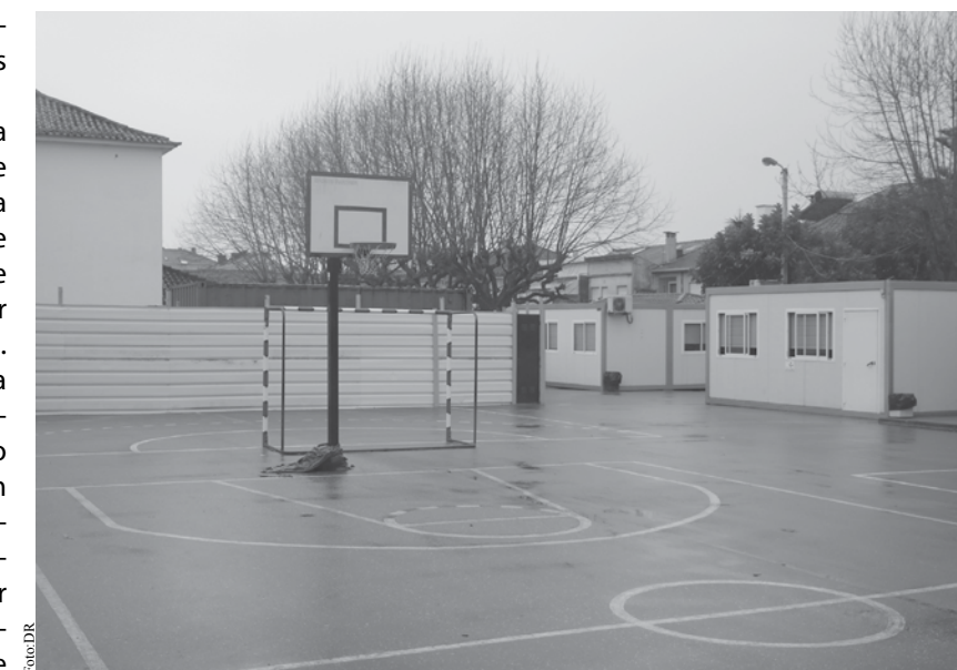
Atividades escolares não serão suspensas durante as intervenções.

A Requalificação da Escola Básica Nº 2 de Espinho no valor total