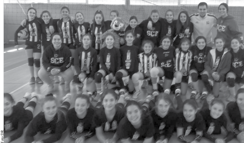
Minis B conquistaram o segundo lugar no Torneio de Ano Novo.

Os Cadetes cederam frente a uma Académica de Espinho pela primeira vez (3-0) e, em casa cheia, frente aos atuais campeões regionais do escalão (Leixões) por 3-1. MV