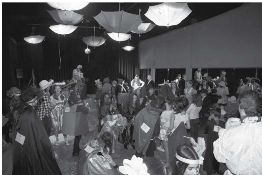
Baile de Máscaras é no dia 2 de março no Auditório da Nascente.

Os três darão, por certo, um excelente contributo para a qualidade e a animação geral de um evento festivo que é já um marco no roteiro do carnaval local. E o mesmo é de esperar por parte da entidade organizadora Nascente, que se prepara para acolher no seu auditório todos os próprios foliões darão o seu contributo para a alegria geral, desde logo com a escolha das máscaras e fantasias que irão exibir. O carnaval da Nascente tem já uma