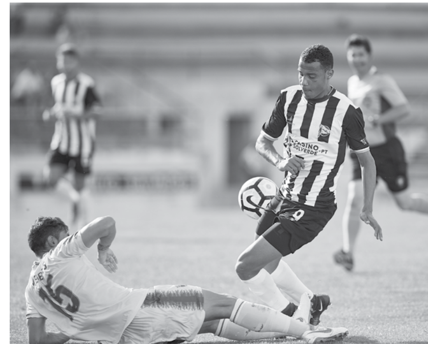
Tigres voltaram às vitórias.