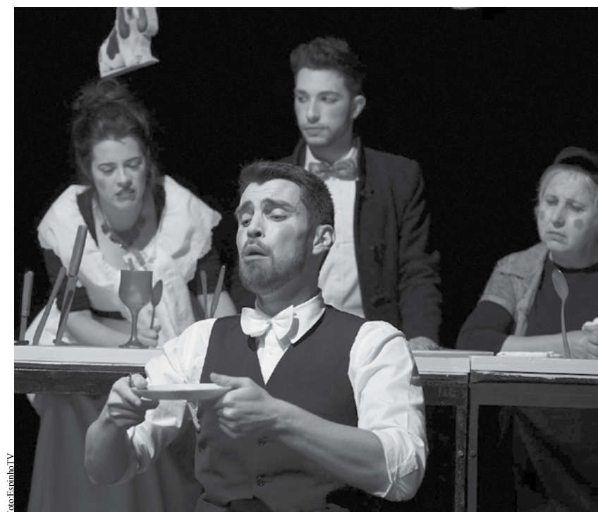
Nova peça do TPE estreou na sexta-feira passada.

O Teatro Popular de Espinho (TPE) estreou a peça “A Boda dos Pequenos Burgueses”. Esta adaptação da obra do dramaturgo alemão Bertolt Brecht, encheu o Auditório Nascente, na última sexta feira e repetiu a dose no dia seguinte. Se ainda não viu não fique alarmado pois o grupo de teatro prepara-se para apresentar mais três sessões nas próximas semanas. Porém, convém comprar o bilhete com antecedência.