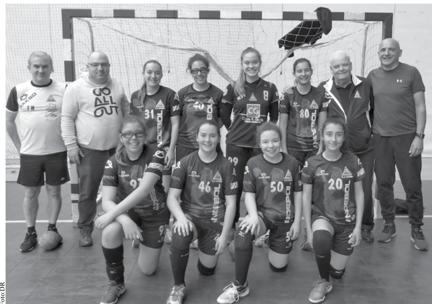
Iniciadas perderam por 33-22 frente ao Alvarium.

A segunda parte foi completamente dominada pela equipa da Académica de Espinho que manteve uma grande concentração defensiva pois apenas sofreu quatro golos, e quando em posse de bola, raramente falhava o seu objetivo.