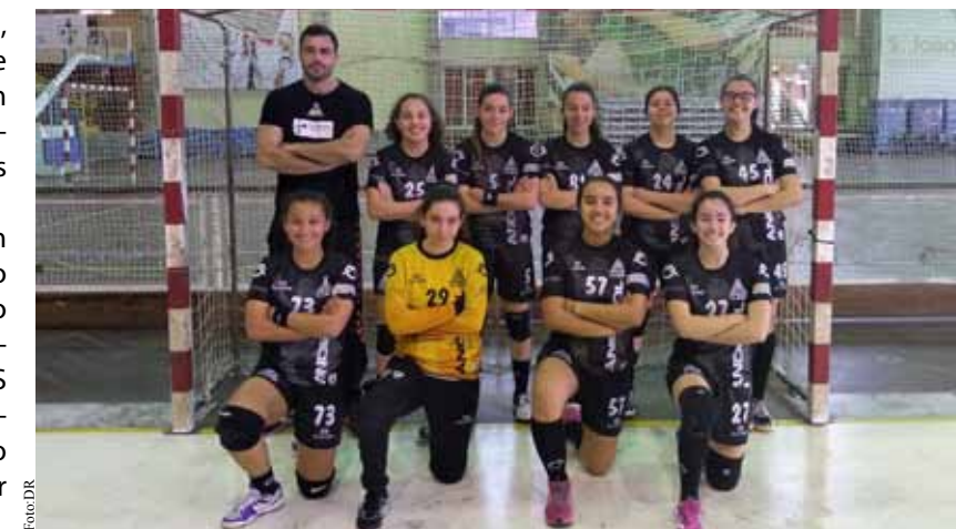
Juvenis venceram por 28-16 a AD Sanjoanense.

A segunda parte começou muito mal para as academistas que nos primeiros 10 minutos não conse- guiram nenhum golo, aproveitan- do a ADS para uma aproximação no marcador. Após este período o treinador da Académica mexeu na equipa e os golos voltaram a acon- tecer na baliza adversaria, resulta- do final 28-16 para a AA Espinho