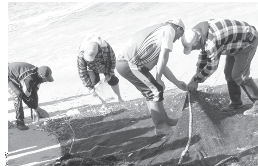
Arte Xávega fará parte do roteiro.