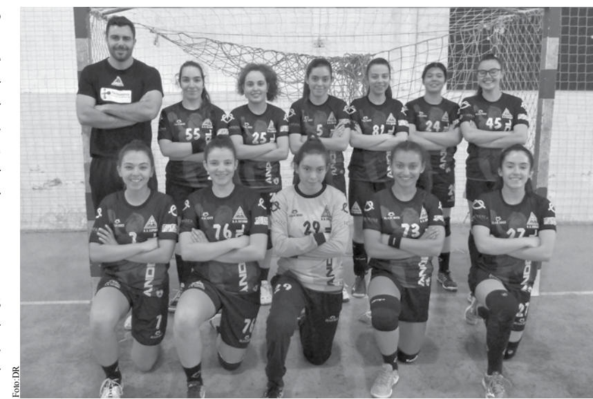
Juvenis venceram por 20-19 o ACD Monte.

vam em campo em Vouzela para defrontar o ASCD SM Mato em jogo a contar para o Campeonato Regional Nível II Juvenil/Juniores.