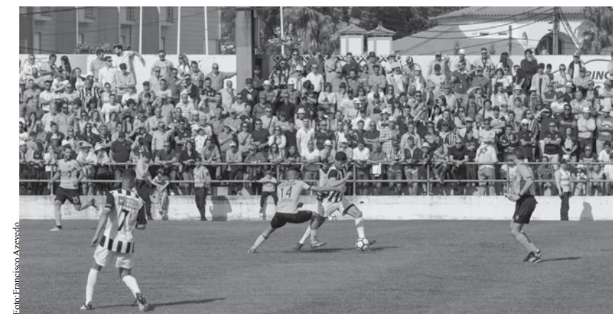
Sp. Espinho e Lourosa podem voltar a encontrar-se na final.

em que ficarão definidas as equipas que sobem de divisão, disputa-se no domingo de 9 de junho. MV