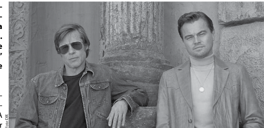
Brad Pitt e DiCaprio são as estrelas de "Era uma Vez em Hollywood".

António Ribeiro é um nome que aparentemente não nos diz nada. Porém, se falarmos em António Variações o caso muda de figura. João Maia realiza o filme que conta o processo de transformação na personagem artística que foi Antó-