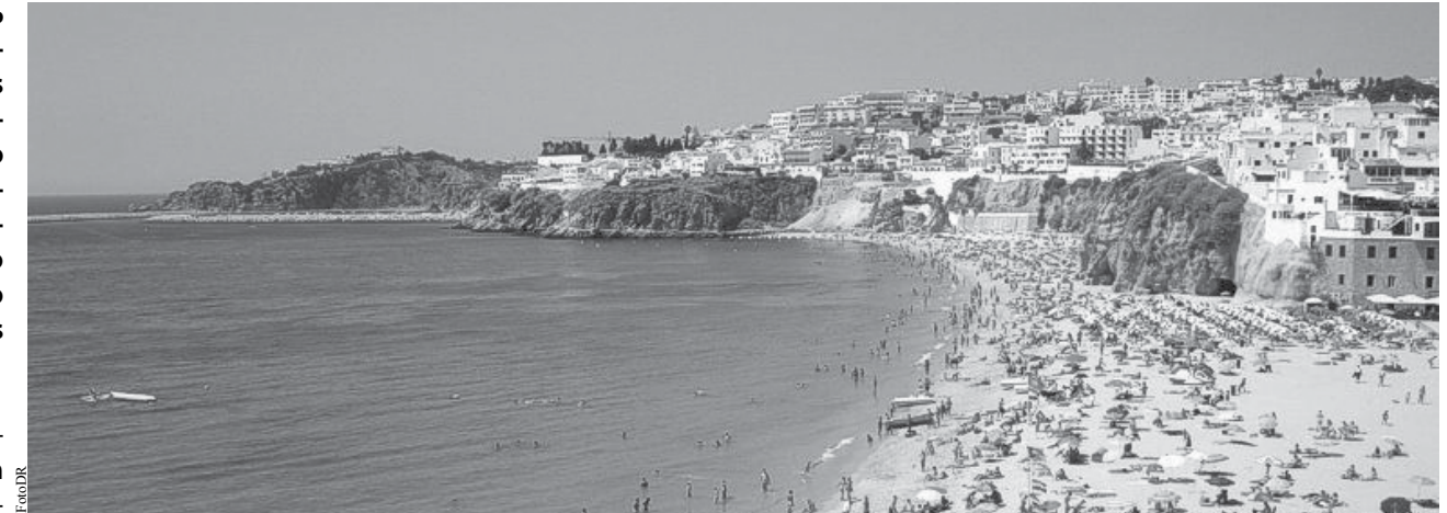
Albufeira é um dos locais muito procurado pelos espinhenses para as férias de verão.

S egundo um estudo, 46% dos portugueses pretendem gastar o subsídio de férias para financiar o período de descanso e lazer nesta época do ano. Os espinhenses não destoam e também preferem gastar esse “extra” num período dedicado ao descanso centrado normalmente em uma ou duas semanas.