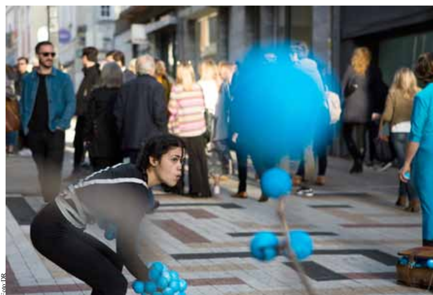
A Nascente organiza no dia 21 uma visita à Feira do Livro no Porto e às inaugurações simultâneas das galerias de arte da zona de Miguel Bombarda.

Sobre as atividades mais específicas de setembro, pode já registar que o Pensar nas Freguesias passa este mês, no dia 14, por Anta-Guetim, para debater um tema importante para o desenvolvimento daqueles territórios, o chamado turismo inclusivo e sustentável, centrado nas pessoas e suas necessidades. E que Guetim é o local de apresentação, no dia 22, do novo projeto de sustentabilidade ambiental que a Nascente está a promover, numa parceria com a Junta de Freguesia e com o Agrupamento de Escuteiros de Espinho e que visa a intervenção na Ribeira do Mocho, no sentido de desenvolver ações de melhoria daquela linha de água que atravessa o