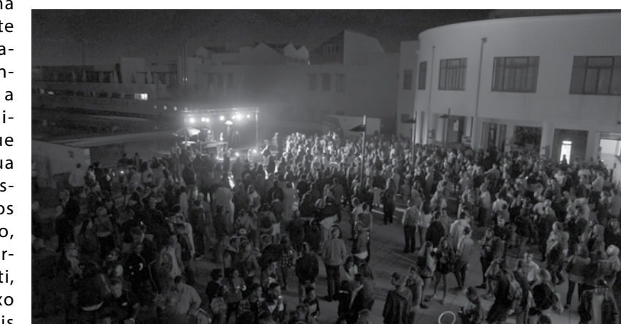
Festa na Piscina foi muito procurada.

contou com mais um palco em relação à edição anterior. Instalados na Avenida Maia-Brenha, uma das grandes diferenças registadas no fluxo de pessoas para entrarem e saírem daquele local prendeu-se com a ponte pedonal que permitiu uma ligação com a parte de cima da linha sem ser necessário vir à rua 15. À semelhança do ano anterior várias artérias foram também cortadas e a solução para estacionar era simples: utilizar o recinto da feira semanal ou o parque de estacionamento na zona do Rio Largo. NO