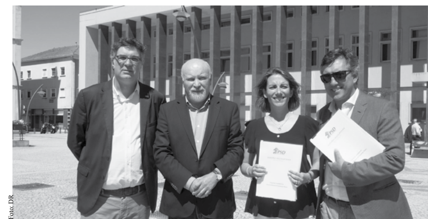
Lista foi entregue no dia 15 de agosto no Tribunal de Aveiro.