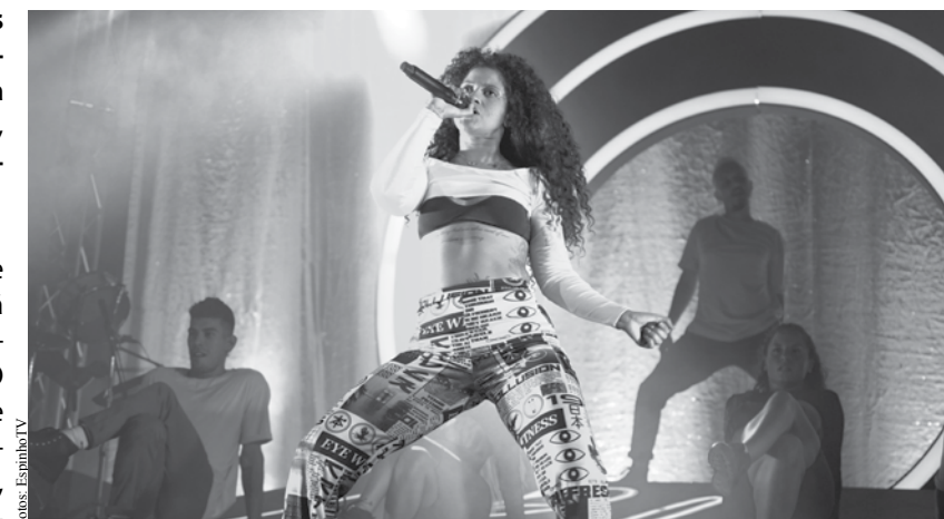
Blaya foi a segunda a atuar no sábado à noite.

A celebração da passagem de ano de verão arrancou na sexta-feira com as atuações de alguns DJs e diversão em vários espaços e ruas da cidade. A partir das 22h, o aquecimento do evento foi assegurado pelo DJ da Rádio Comercial Nuno Luz, no Palco Rádio Comercial, e pelo DJ Disca Riscos, no Palco Esplanada. Para além disso, vários espaços de diversão