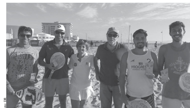
Vencedores do Torneio de Ténis de Praia.

Dentro de duas semanas (14 e 15 de setembro) há novo torneio social com as inscrições a decorrerem nos contactos habituais do Clube de Ténis de Espinho, ou nas instalações da Junta de Freguesia de Espinho (Rua 23 n.º271, 4500-217 Espinho). MV