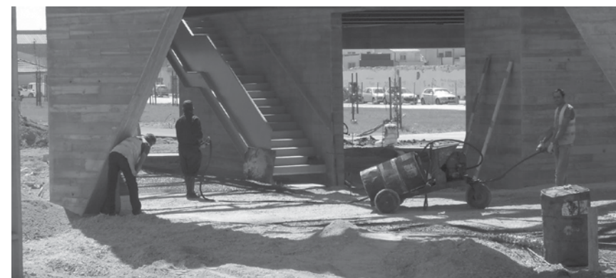
Está a ser colocado o pavimento no edifício da Praça Progresso.

Devido também à festa de Nossa Senhora da Ajuda, foi reforçado o passeio em frente à capela para garantir a segurança na altura da entrada e saída dos andores no domingo. NO