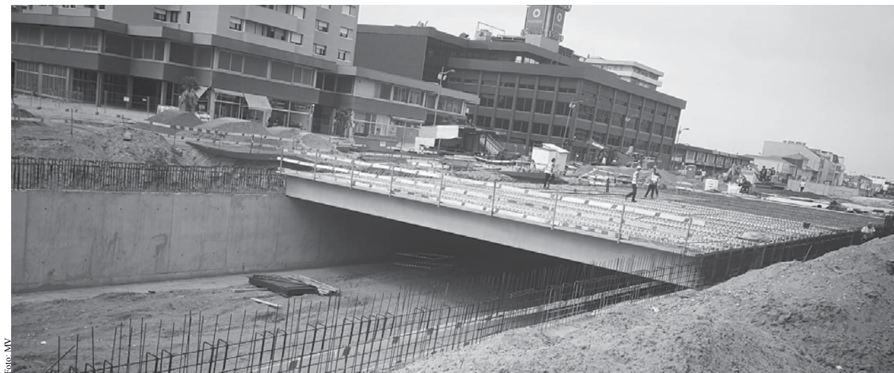
Teto do futuro parque de estacionamento já começou a ser construído.

Lurdes Ganicho espera que toda a parte central entre o Largo da