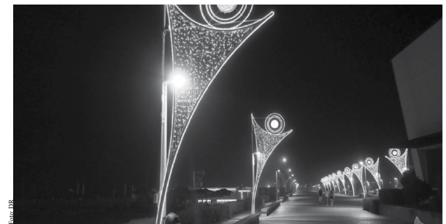
Ruas 23, 19 e Avenida Maia/Brenha já estão iluminadas.

dos no terreno perto da Estação do Vouga devido à distância do palco principal que será montado na Avenida Maia/Brenha. Aparentemente, nessa mesma Avenida, a zona dedicada aos divertimentos não terá ligações que permitam potência suficiente para sustentar os carrosséis.