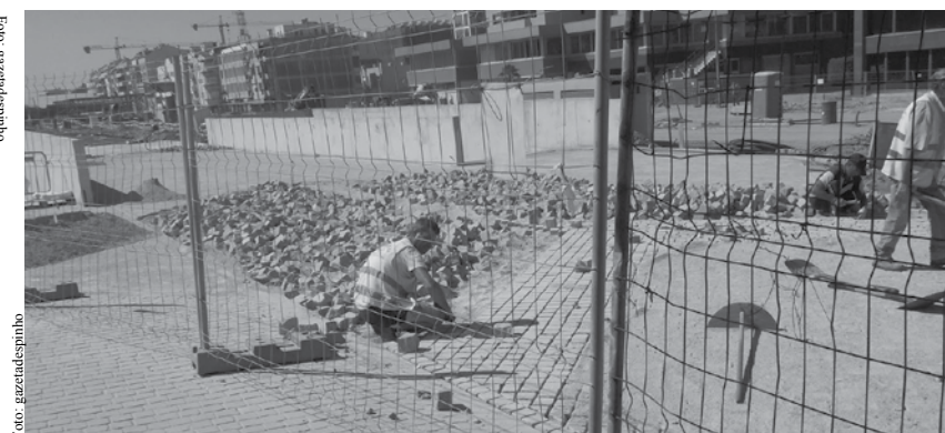
Acessos futuros ao estacionamento praticamente prontos.