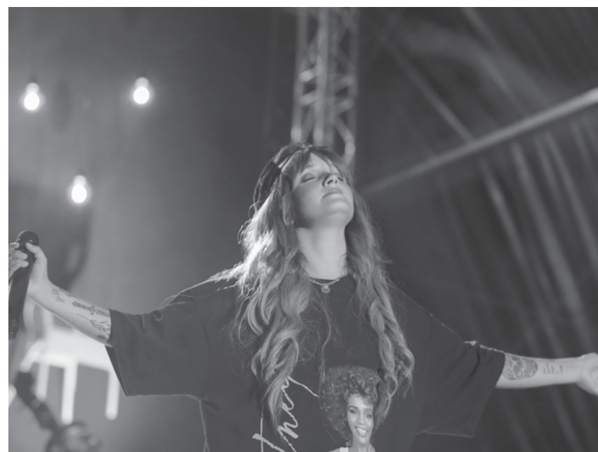
Carolina Deslandes atuou no sábado à noite.