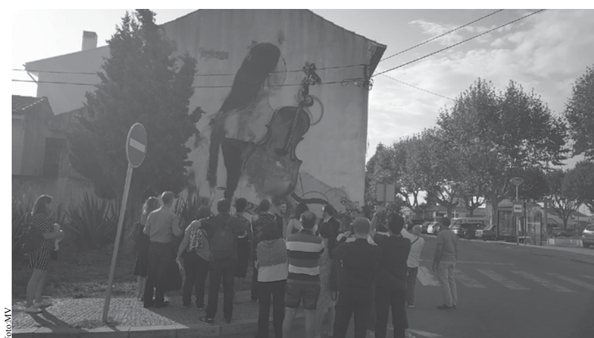
Mural da autoria de Nek foi inaugurado no final da conferência.

Após finalizarem as intervenções dos convidados e de responderem a algumas perguntas por parte do público, o ciclo terminou com a visita a mais uma obra criada pelo artista gráfico Nek: um mural de graffiti ligado ao tema tratado na conferência. CM