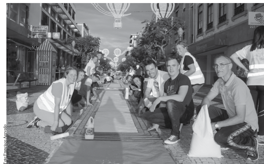
Tradição dos tapetes de flores reúne 300 voluntários.