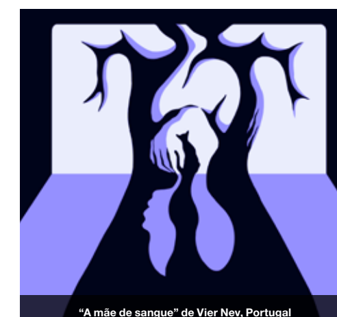
"A mãe de sangue" de Vier Nev, Portugal

52 Número de curtas-metragens selecionadas para competição