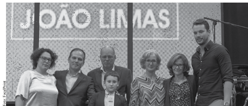
NO JANTAR/FESTA PSD

precisa, mais que nunca, de uma equipa capaz de lidar com estes novos tempos, de pessoas que coloquem sempre o concelho em primeiro lugar. Estou pronto! Estou disponível para abraçar convosco esse futuro! Nós estamos prontos para dar continuidade a este projeto. Seremos competentes a cumprir novas missões, para continuar a merecer a confiança dos espinhenses”, destacou. NO