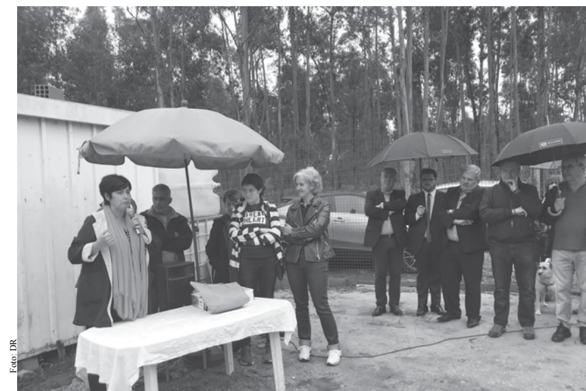
Inauguração do novo espaço foi “abençoada” pela chuva.