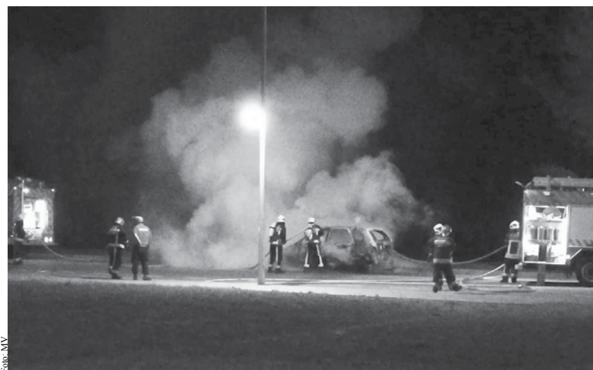
Viatura ficou totalmente destruída.

Na segunda-feira ao final da tarde, muitos automobilistas não ganharam para o susto. Uma viatura ligeira de cor branca seguia pela Avenida da Liberdade em S. Félix da Marinha em direção a Espinho quando de repente se incendiou. O ocupante da viatura parou o veículo e ainda tentou apagar o incêndio com recurso a panos e roupa. Contudo, as chamas rapidamente se estenderam por várias partes da viatura e apenas restou uma solução: ligar para o 112. Contudo, após pelo menos duas chamadas para o número de emergência, os Bombeiros do Concelho de Espinho e os Bombeiros Voluntários da Aguda demoraram mais de 15 minutos a comparecer. Quando chega-