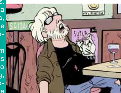
"A Cidade dos Piratas" de Otto Guerra (Brasil) está selecionada para a competição de longas-metragens