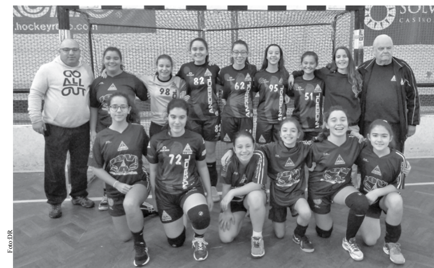
Seniores perderam por 12-42 frente à equipa do CP Valongo do Vouga.

Era de prever, como veio a acontecer, um jogo muito difícil para as academistas que receberam uma das candidatas ao título. A equipa de Valongo do Vouga cedo mostrou que ia dominar o jogo e em poucos minutos já conseguia vencer por 0-6. Existiu uma pequena reacção por partes das espinhenses que conseguiram marcar três golos sem