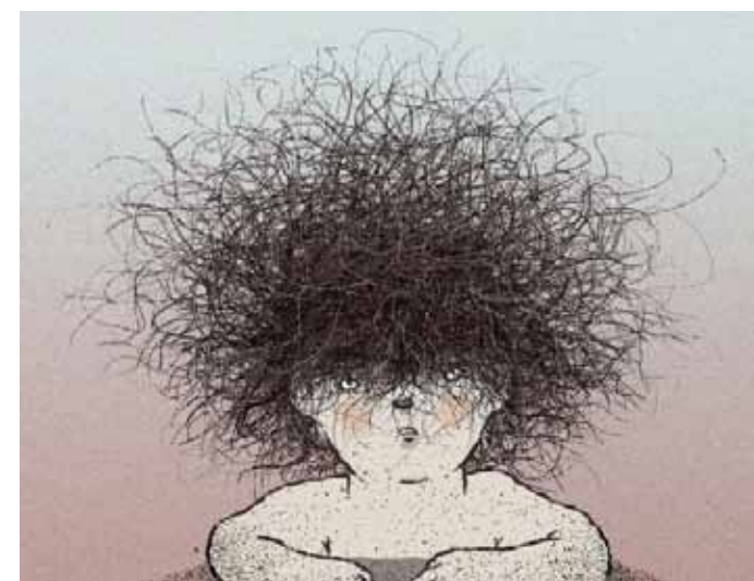
Imagem do filme "Purpleboy".

festival que tem uma grande projeção a nível internacional e é muito conhecido lá fora. Tenho a certeza que poderá contribuir para ganhar outro reconhecimento, ganhar outros prémios, noutros festivais. Acrescento que frequento o CINANIMA há mais de 20 anos e ganhar