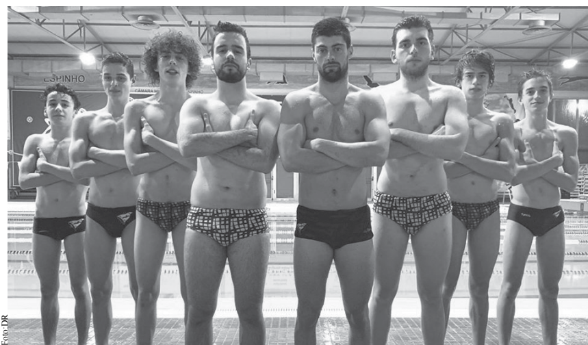
Equipa tigre presente em Sines.

No final da competição foram batidos e 15 recordes pessoais (incluindo tempos parciais), dos quais