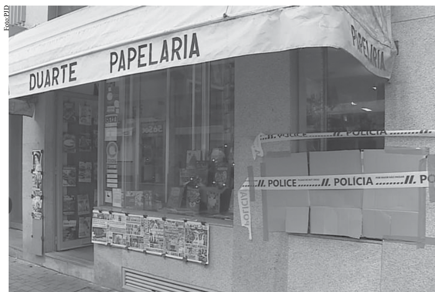
É a segunda loja em Espinho a ser assaltada com o mesmo "modus operandi".

Este é o segundo assalto num curto espaço de tempo no centro da cidade de Espinho em que o