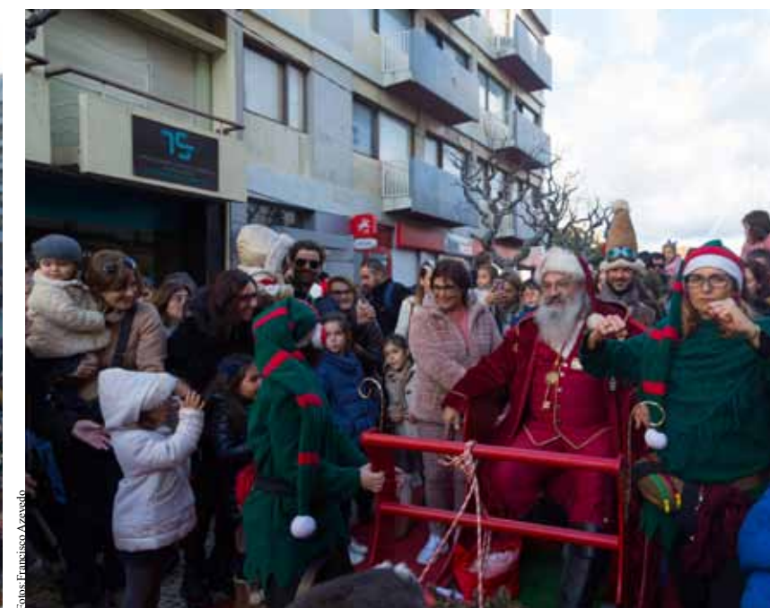
Pai Natal fez a alegria dos mais novos.