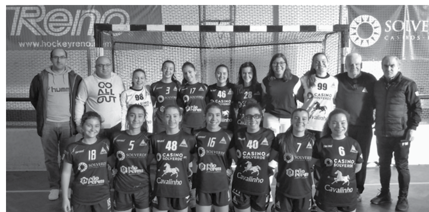
Juvenis perderam por 28-15 com o CP Valongo do Vouga.

Ao início da tarde de sábado as Juvenis academistas receberam a sua congénere de Valongo do Vouga em encontro a contar para o Campeonato Nacional.