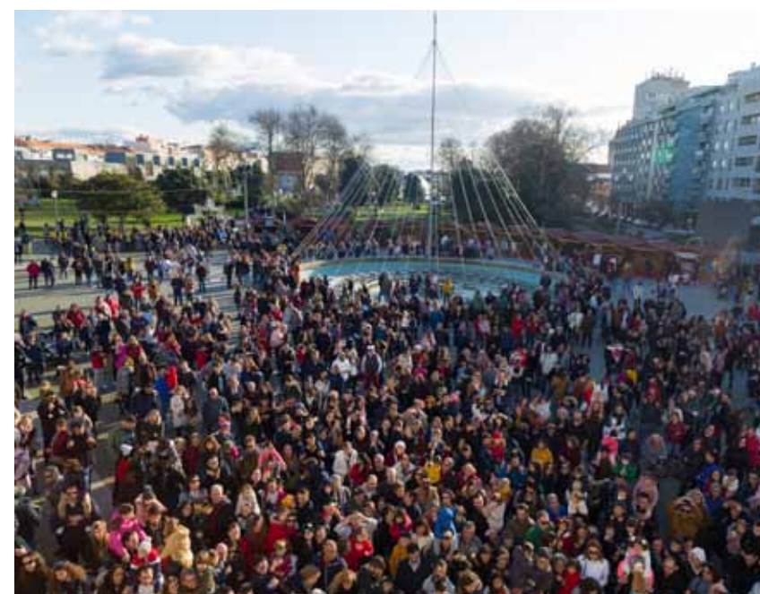
Pequenos e adultos à espera do Pai Natal.