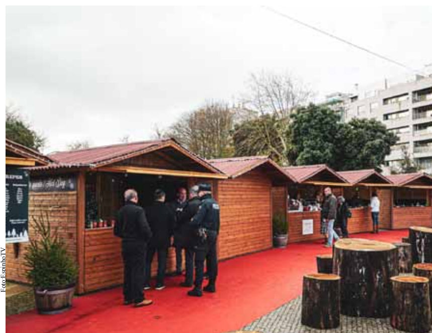
Mercadinho de Natal foi inaugurado no domingo.