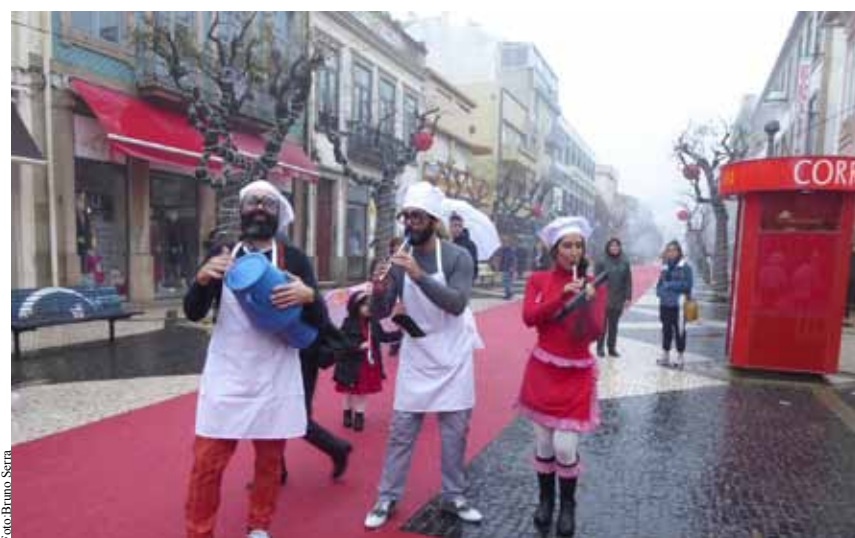
Mesmo debaixo de chuva não faltou animação de rua.