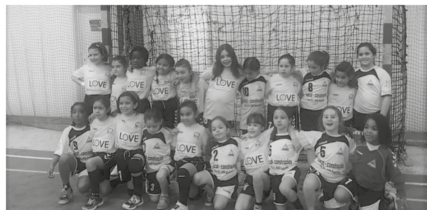
Minis da AAE fizeram o jogo de estreia em Aveiro.

No domingo, a equipa de juniores do Sp. Espinho deslocou-se a Águeda para encontro a contar para o Campeonato Nacional de Juniores Masculinos (Zona 2). Num jogo em que desde cedo os espinhenses demonstraram a sua superioridade face aos adversários, o resultado foi naturalmente acompanhando esta demonstração, tendo-se o resultado final cifrado em 33 para o Sporting Clube de Espinho e 25 para a turma da casa.