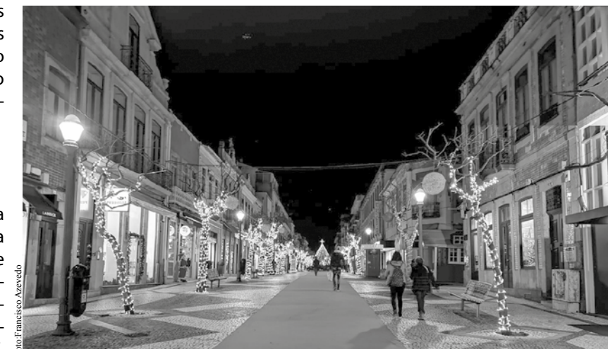
Maioria dos espinhenses opta por fazer compras no comércio tradicional.