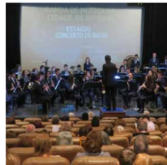
Banda de Música da Cidade atuou domingo.

dy" Alazarra na Cozinha e terminou por esta semana, no domingo com o Concerto de Natal da Banda de Música Cidade de Espinho. Já a próxima semana vai per-