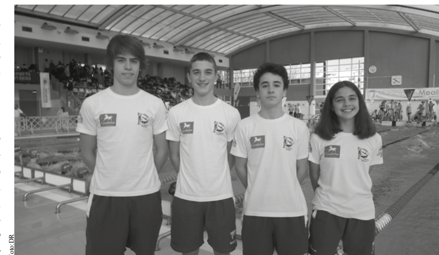
Equipa espinhense presente na Mealhada.

No final da competição, em 13 prova nadadas, foram alcançados 13 recordes pessoais (incluindo