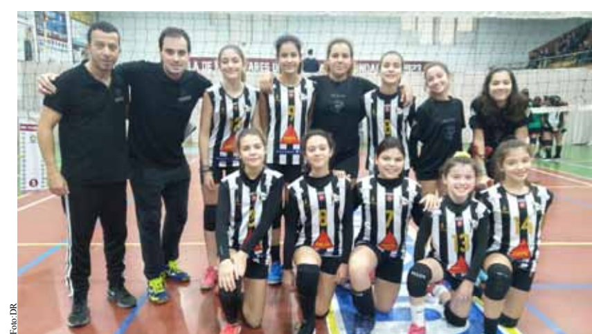
Minis B Femininas ficaram em 3.º lugar no Torneio de Natal.

No setor feminino, as Iniciadas continuam a somar e venceram por 3-0 em Infesta. Apesar de um início atribulado, conseguiram demonstrar a sua superioridade e venceram a partida, mantendo-se invictas no campeonato regional. As Iniciadas Femininas B perderam em casa por 0-3 frente à equipa do CDUP.