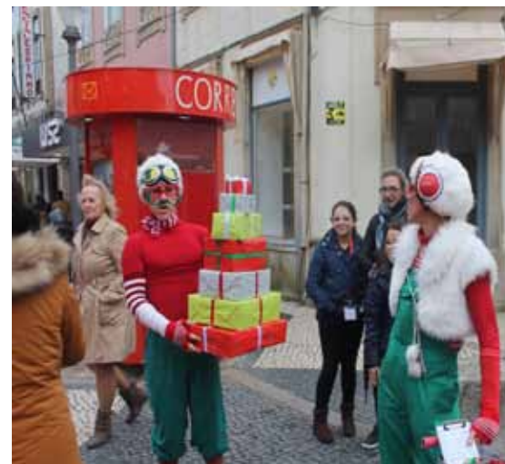
Animação de Rua com "Teleduendes".

Para além disso mantêm-se as animações já definidas, entre elas a Pista de Gelo, o Mercado de Natal e os Passeios de Charrett.