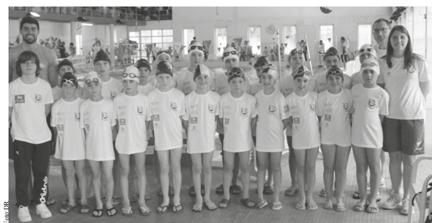
Equipa espinhense presente em Águeda.