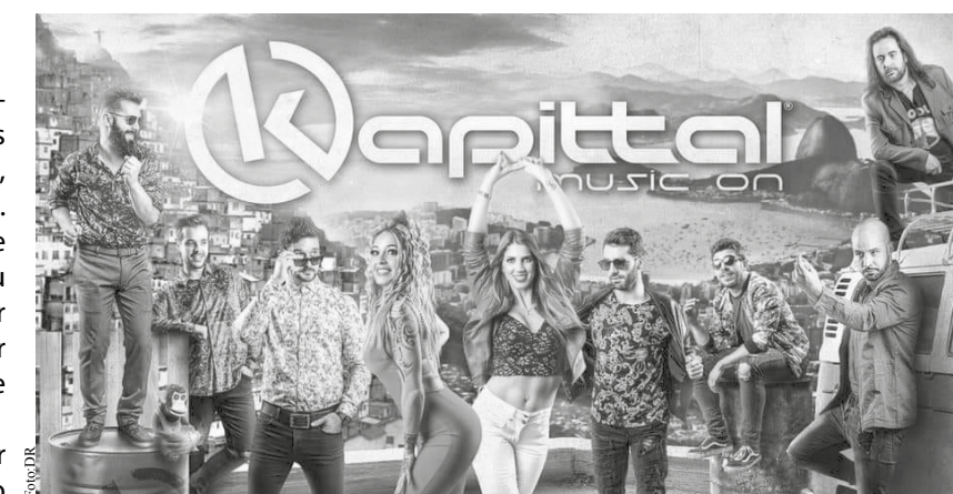
Em Espinho, a animação do Ano Novo estará a cargo do Grupo Kapittal.