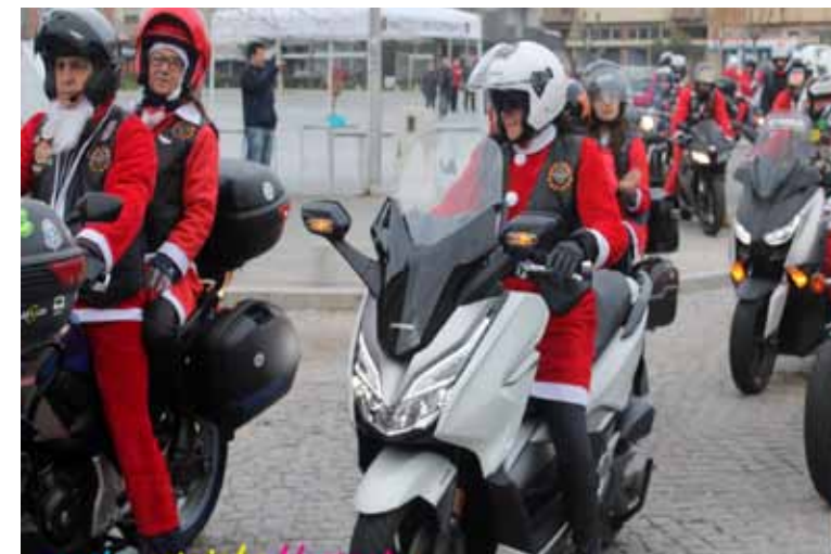
Moto Clube de Espinho organizou o Desfile de Pais Natal Motards.

Contaremos ainda com o Concerto de Natal