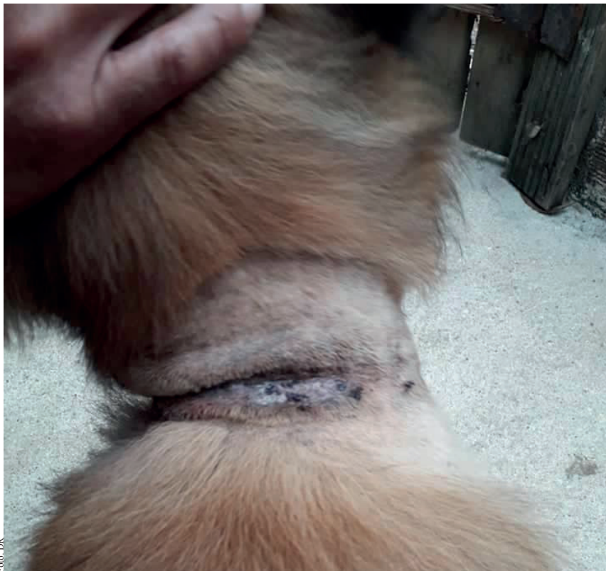
São visíveis as marcas em alguns animais recolhidos no canil ilegal de Santo Tirso.

Precisamente no ano de 2019, as receitas da Associação rondavam os 76 mil euros, enquanto as despesas chegaram quase aos 88 mil euros, apresentando assim, um saldo negativo cerca de 11 mil euros. A maioria das dívidas insere-se nos cuidados veterinários. JR