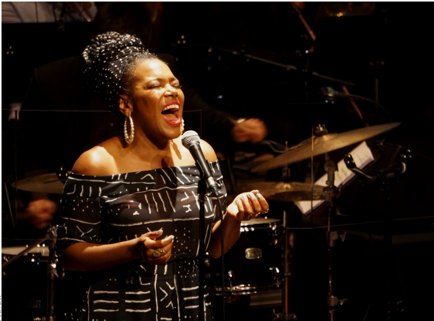
China Moses atuou na sexta-feira passada.

Com lotação esgotada, China Moses mostrou-se como peixe dentro de água no concerto integrado na 46.ª edição do Festival Internacional de Música de Espinho. Ainda há quatro concertos em agenda até ao final do Festival.