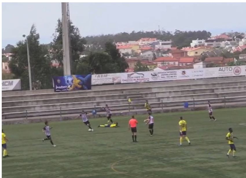
Tigres voltaram a perder pontos. E vão já duas jornadas sem ganhar.

Jogo no Complexo Desportivo de Valadares.