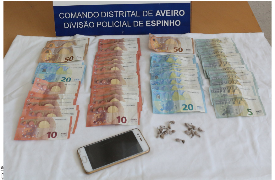
Homem foi detido com 540 euros e 28 doses de heroína.

Segundo a PSP, o indivíduo já tinha sido detido por esta Polícia, em março e agosto do corrente ano, pela prática do mesmo