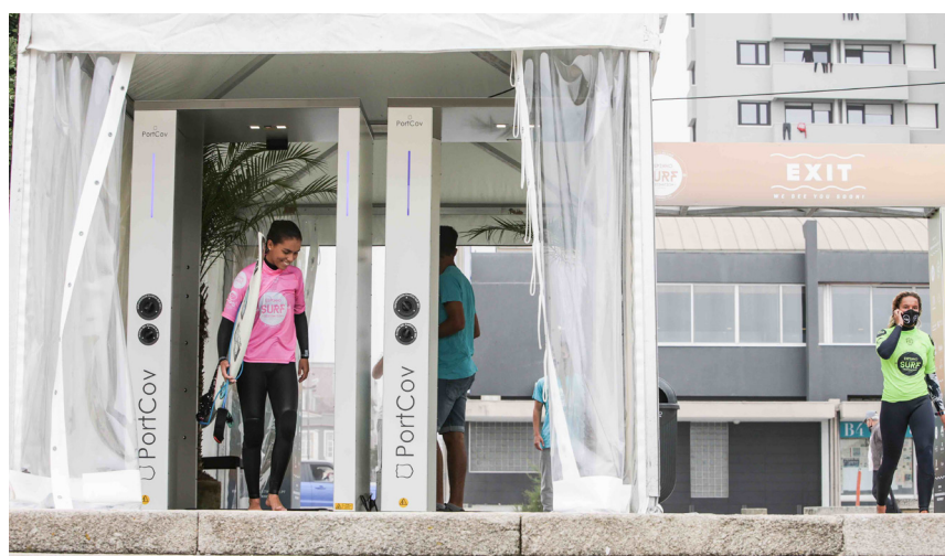
À entrada do recinto está montado um pórtico desinfetante para análise de temperatura e higienização de todos os intervenientes.

O Junior Pro Espinho regressa hoje [dia 7 de outubro], a partir das 8h30m, para o arranque da prova masculina, podendo acompanhar tudo através do site oficial da World Surf League, em www.worldsurfleague.com . NO