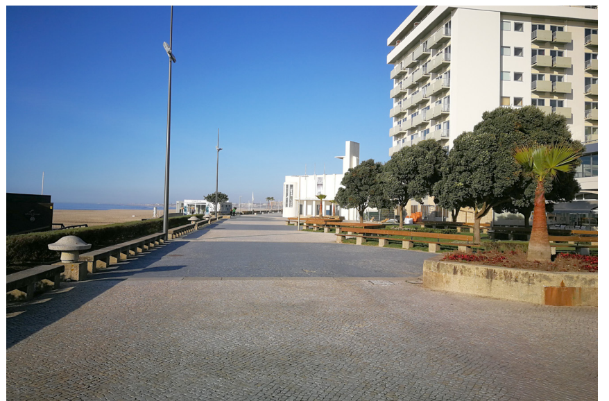
No sábado e no domingo, a partir das 13h00, a cidade de Espinho ficou despida de gente