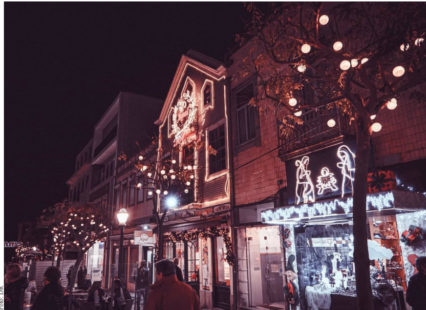
Durante dezembro serão atribuídos vouchers nas compras no comércio local

“Face ao quadro económico e às dificuldades que atravessa o comércio tradicional, a Câmara Municipal vai implementar um conjunto de incentivos ao consumidor para fazer as suas com-