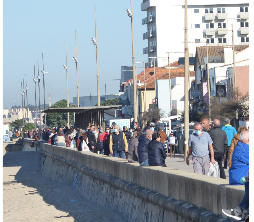
Foram muitos os que aproveitaram o sol para dar um passeio no sábado e domingo de manhã

N o domingo o nome de Espinho surgiu nas notícias a nível nacional pelas piores razões. No sábado e no domingo de manhã, centenas aproveitaram o bom tempo para dar um passeio fazer compras ou até beber um café antes do confinamento (às 13h00). O problema não é terem saído de casa. O problema é que muitos não usavam máscara e as regras de distanciamento não foram cumpridas. Depois das 13h00, o cenário mudou radicalmente com as ruas vazias.