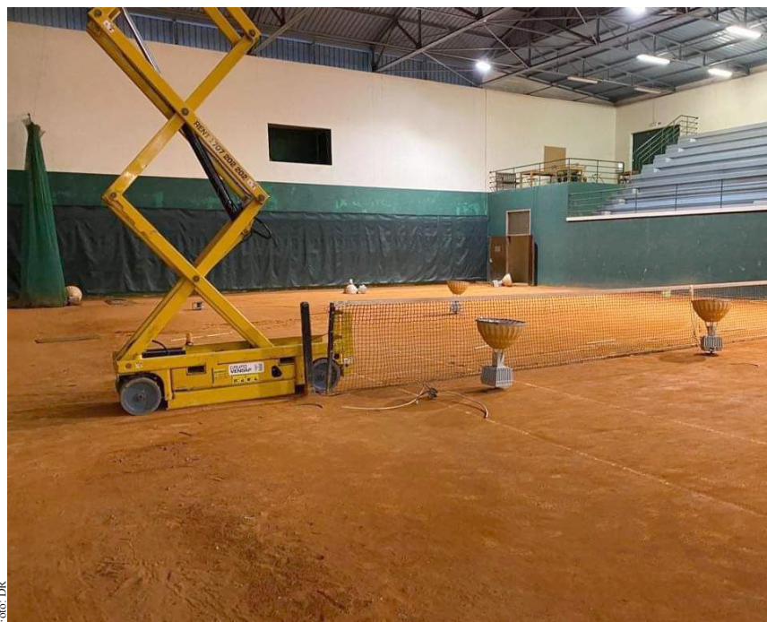
Candeeiros foram substituídos por um novo sistema de iluminação led

C om vista a dar início ao processo de gestão do Complexo de Ténis de Espinho, o Clube de Ténis de Espinho (CTE) está a promover reuniões com os sócios com vista à explicação do novo processo de gestão e os benefícios que estes poderão retirar do mesmo,