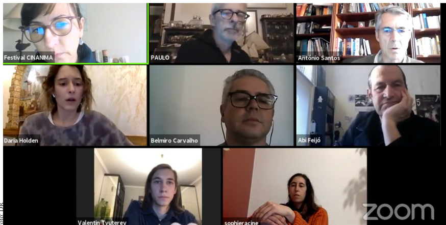
O CINANIMA promoveu um "Zoom Meeting" com alguns dos realizadores vencedores da edição 2020

A edição 2020 do CINANIMA teve contornos bem diferentes das habituais. Devido à pandemia o Festival realizou-se em formato online e deu provas da sua versatilidade. O balanço é positivo e já há novidades.