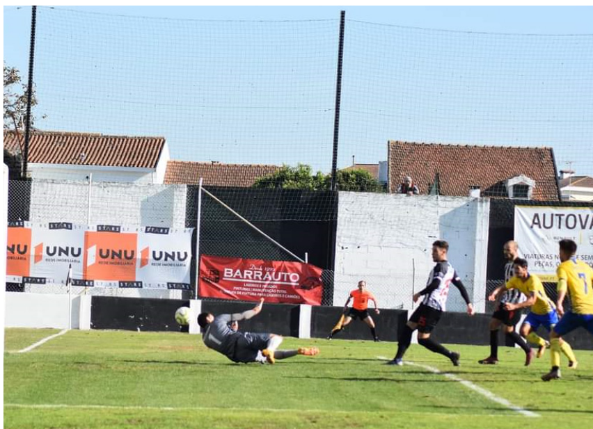
Tigres chegaram à vantagem já no cair do pano