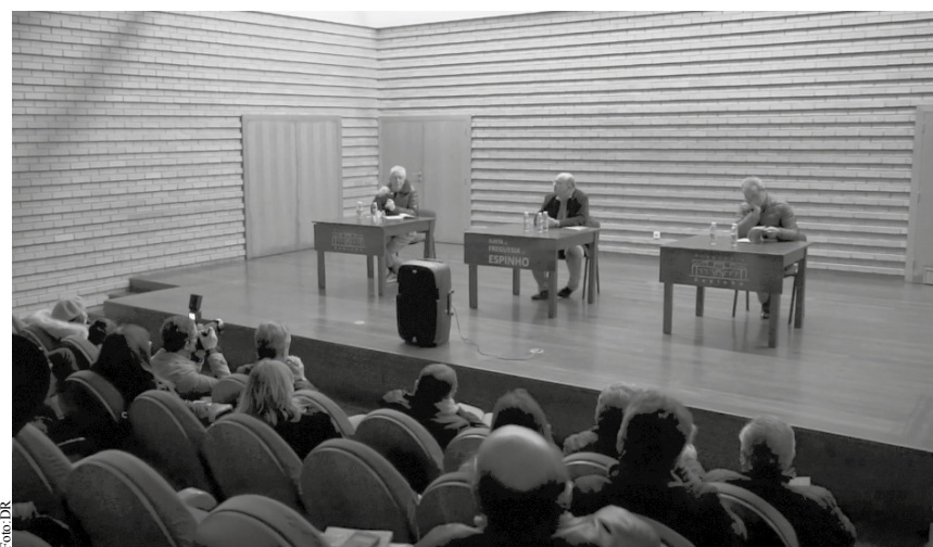
Apresentação do livro foi na Junta de Freguesia de Espinho

Nesta obra, a sétima a ser apresentada, o trabalho de pesquisa e escrita foi dedicado às "Histórias de uma Terra Nova" com destaque para as lutas da autonomia do concelho de Espinho. No livro é contada a história de Espinho ter pertencido a Ovar até 1855 e só depois passou a ser um lugar da freguesia de Anta que pertence