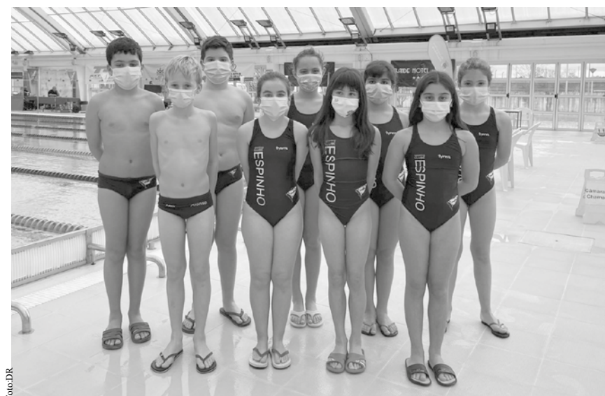
Equipa espinhense que marcou presença na Mealhada