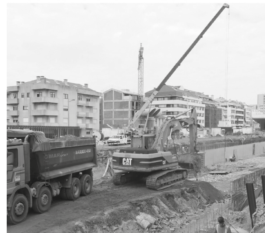
Orçamento prevê 4 milhões de euros para as obras do ReCaFE

por 2023, 2024 e 2025. Na Rede de Água e Saneamento estão previstos investimentos na expansão da rede para zonas ainda não servidas desta infraestrutura e na renovação/ substituição da rede antiga, essencialmente no centro da cidade. Para