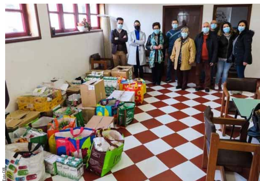
A AFPCE recolheu e entregou os bens alimentares à Sociedade de S. Vicente de Paulo de Paramos