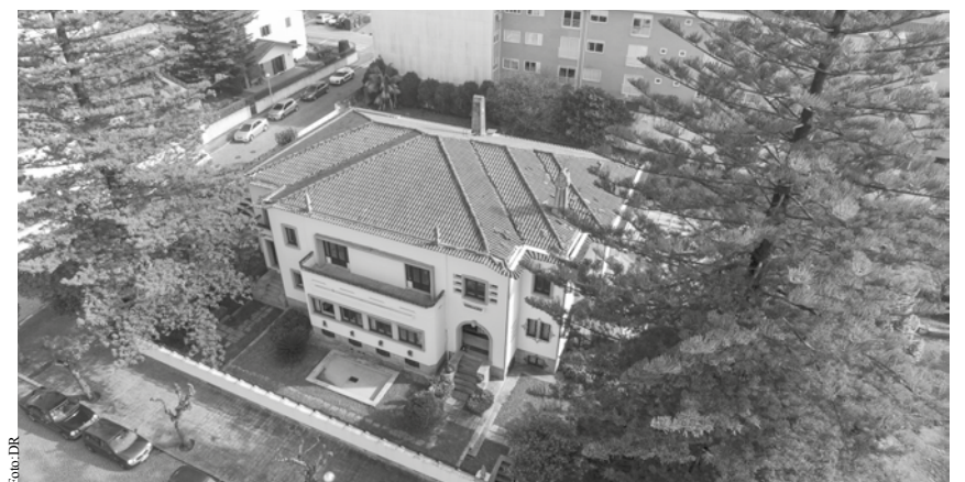
Espinho Vintage vai receber uma família de 14 pessoas no Natal

O “Espinho Vintage” está a aproveitar esta altura em que as reservas não sou muitas para remodelar e expandir a casa. No fim das mesmas, em vez de cinco quartos, existirão 15: uns duplos, outros tripos e outros